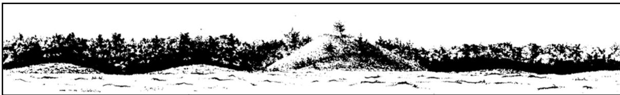
Рис. 28. Графическая реконструкция курганов 6—10. Авторы Н. А. Кетрару, Л. В. Кердиварэ (Кетрару, 1982, рис. 26).

(№3) — в позднебронзовое время над единственным белозёрским погребением; третий (№2) — в скифское время и содержал два захоронения. В этот же могильник входит курган №35, исследования которого невозможны, поскольку на нём с 1968 г. находится мемориальный комплекс, посвящённый воинам Великой Отечественной войны.