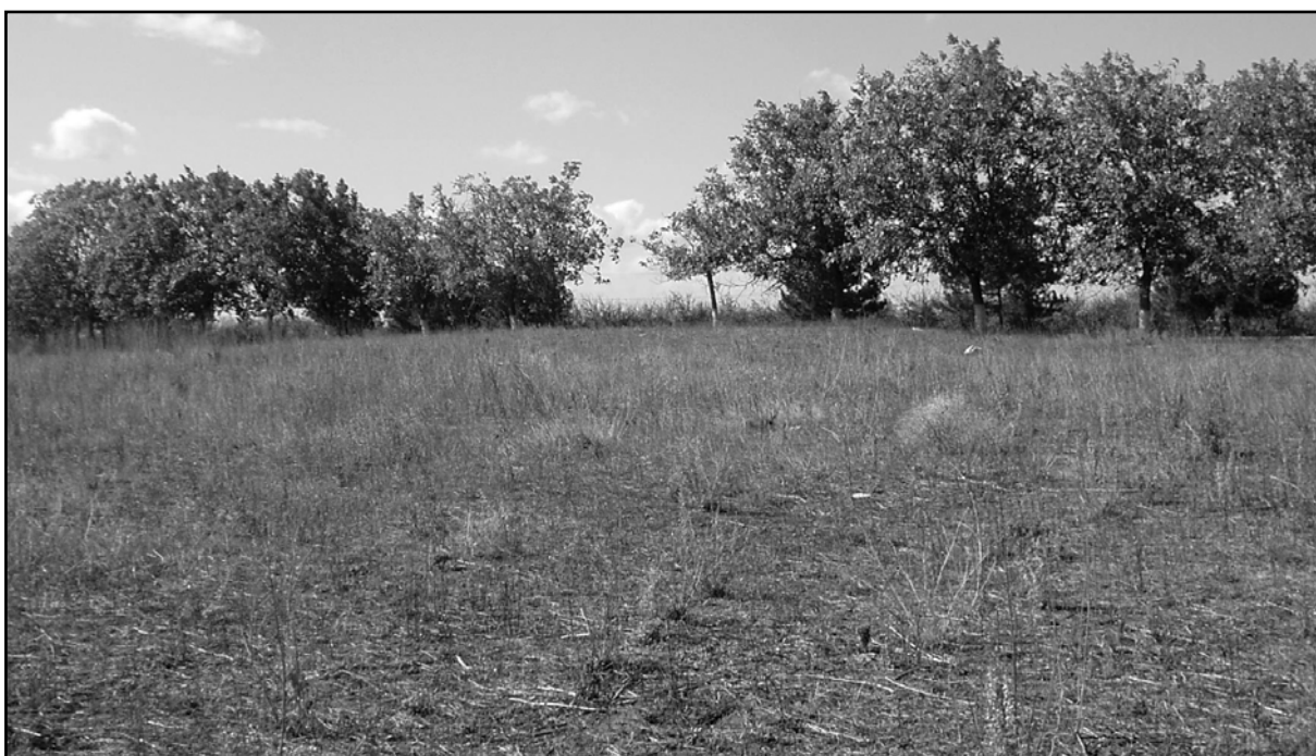
Рис. 20. Курган 33 (Дороцкое).

ждающий отчёт о раскопках 1987 г., бесспорно свидетельствует о том, что курган под №34 расположен именно на землях с. Дороцкое, южнее кургана №33 (Кетрару, 1988, рис. 2).