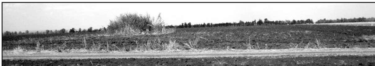
Рис. 26. Курган 48 (Ново-Комиссаровка).

востоку от кургана №51 и в 0,015 км к северу от кургана №11. Исследован в 1987 г.