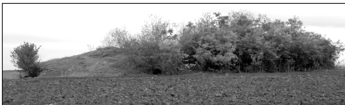
Рис. 22. Курган 36 (Погребя).

(Chetraru, Serova, 2001, 10; Коваленко и др., 2011, 58, карта IX/2).