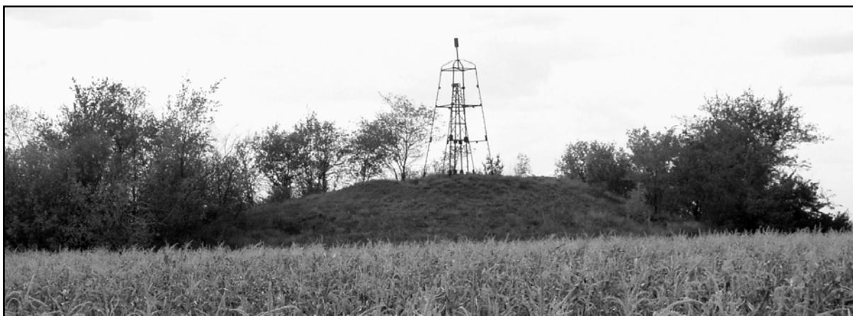
Рис. 18. Курган 8 (Погребя).

в 2 км к северо-востоку от южной окраины с. Дзержинское и шоссе Дубоссары-Тирасполь, в 0,15 км к востоку от полевой дороги, разделяющей земли сс. Дзержинское и Красный Виноградарь. Исследован в 1981 г.