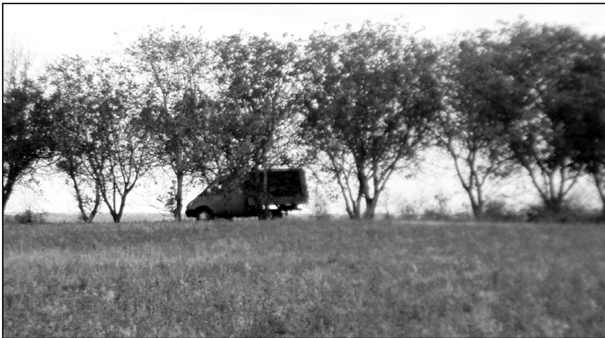
Рис. 19. Курган 32 (Дороцкое).