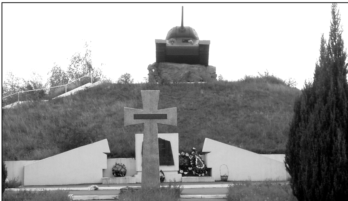
Рис. 21. Курган 35 (Погребя).