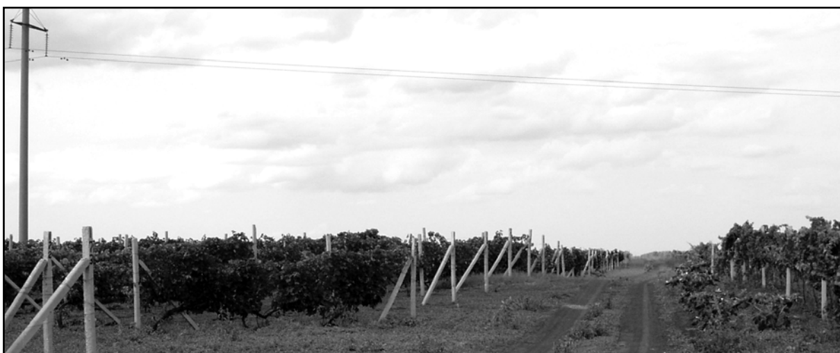
Рис. 24. Курган 38 (Дзержинское).

Курган №38 (Дзержинское) высотой 0,7 м и диаметром 35—45 м (рис. 24) находится в 2,5 км к востоку от северной окраины села, в 0,6 км к западу от насосной станции, в 1,5 км к юго-востоку от тракторной бригады (Коваленко и др., 2011, 32, карта III/1) 4 . В отчётах о раскопках не содержится никакой информации об этом кургане. Курган не был исследован. Эта небольшая насыпь была обнаружена в 1986 г., когда она впервые появляется на си-