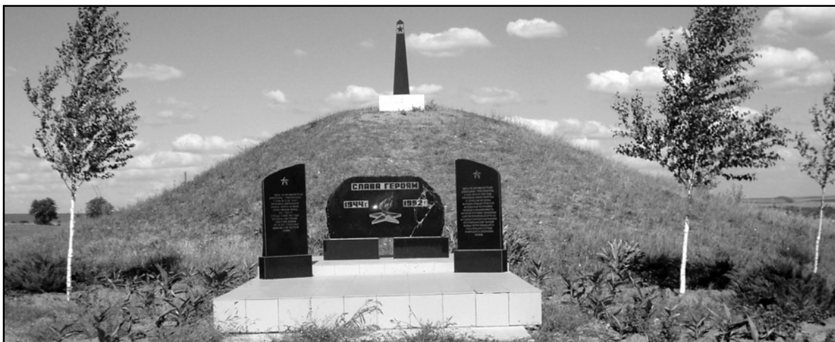
Рис. 23. Курган 37 (Дороцкое).