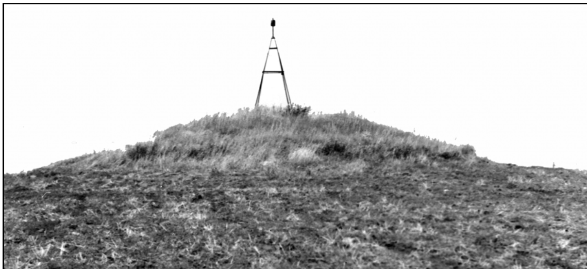
Рис. 25. Курган 44 (Дубово).

роги из с. Васильевка в с. Фёдоровка (Украина), в 1,45 км от её пересечения с дорогой, ответвляющейся от шоссе Кишинёв-Полтава и ведущей в с. Ново-Комиссаровка. Исследован в 1986 г.