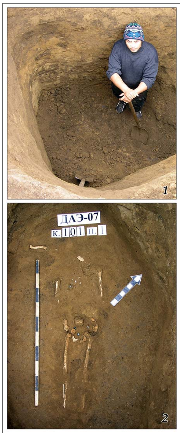
Рис. 18. Раскопки могильника у с. Глиное в 2010 г.: 1 — И.А. Четвериков во входной яме погребения 101/2; 2 — погребение 101/1.

Fig. 18. Excavations of the Glinoe cemetery in 2010: 1 — I.A. Chetverikov in the entrance well of burial 101/2; 2 — burial 101/1.