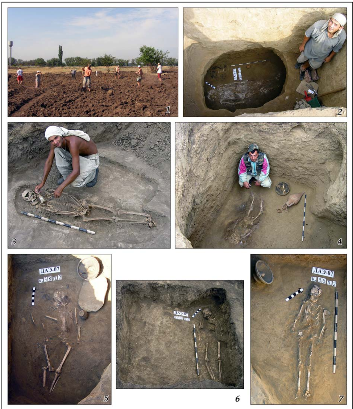
Рис. 15. Раскопки могильника у с. Глиное в 2007 г.: 1 — студенты-практиканты разбивают раскоп на кургане 85; 2 — И.А. Четвериков после расчистки погребения 2 кургана 41, исследования которого были начаты в 2000 г.; 3 — А.В. Корецкий после расчистки погребения 2 кургана 34, исследования которого были начаты в 1999 г.; 4 — В.С. Синика после расчистки погребения 2 кургана 33, исследования которого были начаты в 1999 г.; 5—7 — погребения, выявленные в курганах, исследование которых было начато в 2000 г. (№№ 38 и 39) и 2001 г. (№ 56).

Fig. 15. Excavations of the Glinoe cemetery in 2007: 1 — students outlining the dig area above barrow 85; 2 — I.A. Chetverikov after cleaning burial 2 of barrow 41, the dig started in 2000; 3 — A.V. Koretskiy after cleaning burial 2 of barrow 34, the dig started in 1999; 4 — V.S. Sinika after cleaning burial 2 of barrow 33, the dig started in 1999; 5—7 — burials found in barrows, there the dig started in 2000 (no. 38 and 39) and 2001 (no. 56).