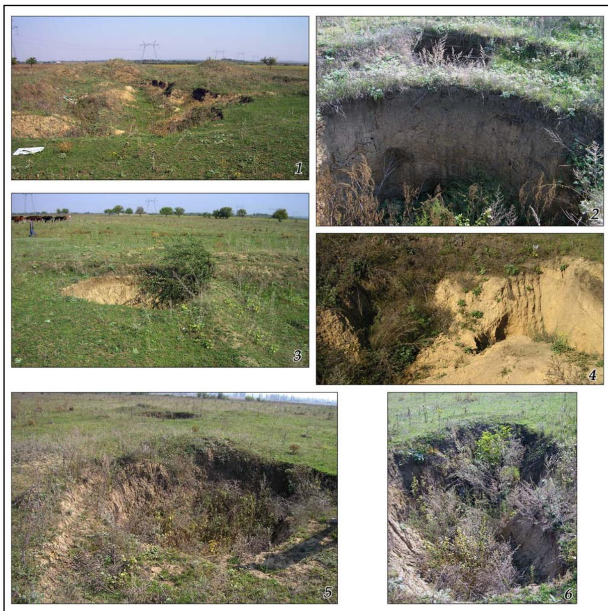
Рис. 12. Фотографии некоторых незасыпанных раскопов могильника у с. Глиное 1995—2003 гг.: 1 — курган 1 (1995 г.); 2 — курган 14 (1997 г.); 3 — курган 31 (1999 г.); 4 — курган 41 (2000 г.); 5 — курган 47 (2000 г.); 6 — курган 48 (2001 г.).