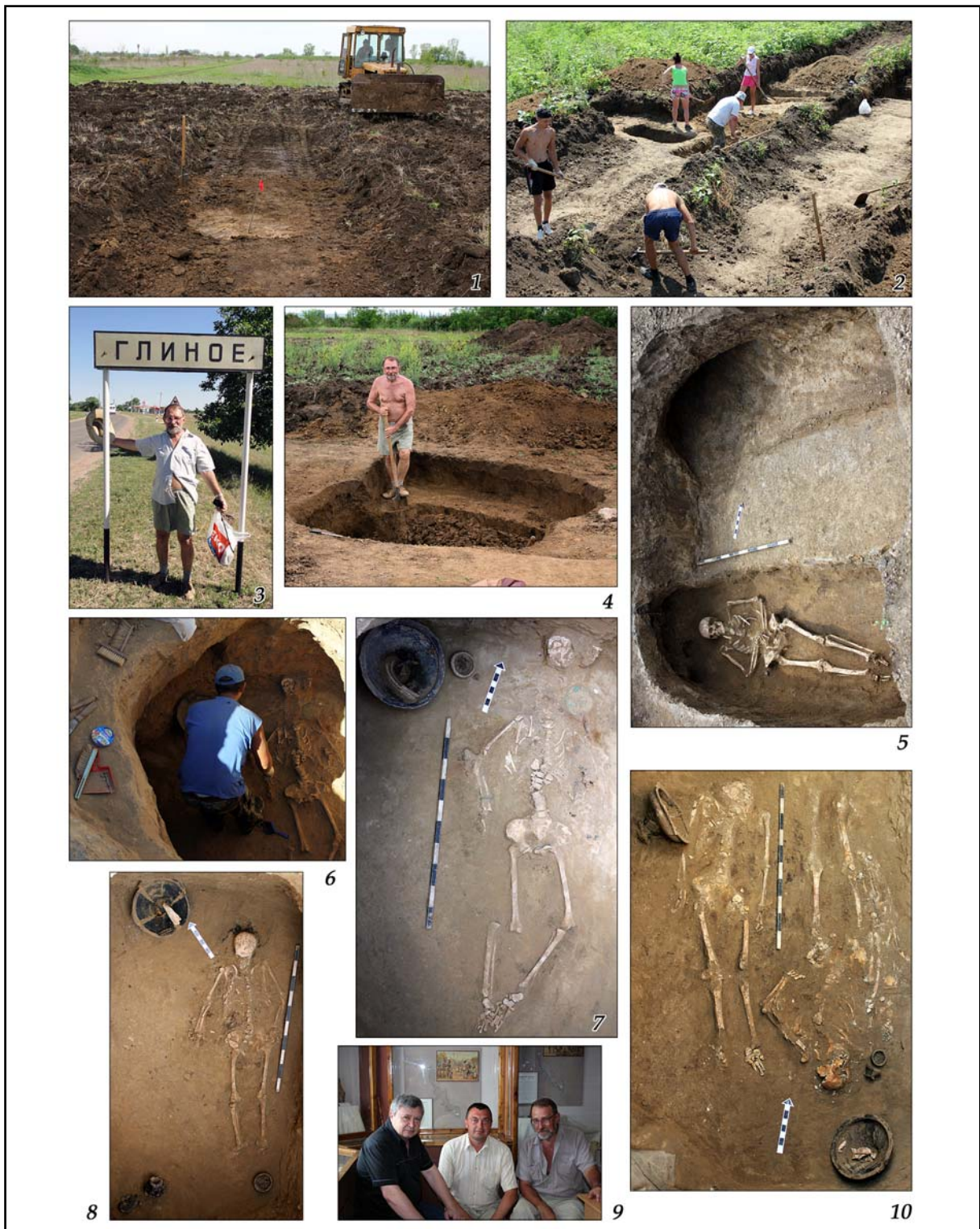
Рис. 19. Раскопки могильника у с. Глиное в 2011 г.: 1 — начало раскопок кургана 102 и обнаружение погребения; 2 — Н.П. Тельнов и студенты-практиканты на раскопках кургана 107; 3, 4 — С.В. Полин в с. Глиное и на раскопках погребения 103/2; 5 — захоронение 103/2; 6 — И.А. Четвериков в процессе расчистки погребения 103/1; 7 — захоронение 103/1; 8 — погребение 109/1; 9 — Н.П. Тельнов (слева), В.С. Синика (в центре), С.В. Полин в Музее археологии Поднестровья ПГУ им. Т.Г. Шевченко; 10 — погребение 105/2.

Fig. 19. Excavations of the Glinoe cemetery in 2011: 1 — beginning of the excavation of barrow 2 and discovery of a burial; 2 — N.P. Telnov and students-practicants on the excavation area of barrow 107; 3, 4 — S.V. Polin in Glinoe village and on the excavation of burial 103/2; 5 — burial 103/2; 6 — I.A. Chetverikov in the process of cleaning of burial 103/1; 7 — burial 103/1; 8 — burial 109/1; 9 — N.P. Telnov (left), V.S. Sinika (in the center), S.V. Polin in the Museum of Archaeology of the Dniester littoral of the Pridnestrovian State University; 10 — burial 105/2.