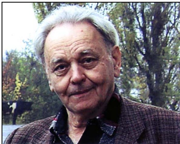
Рис. 21. Геннадий Михайлович Зыков (1931—2013).