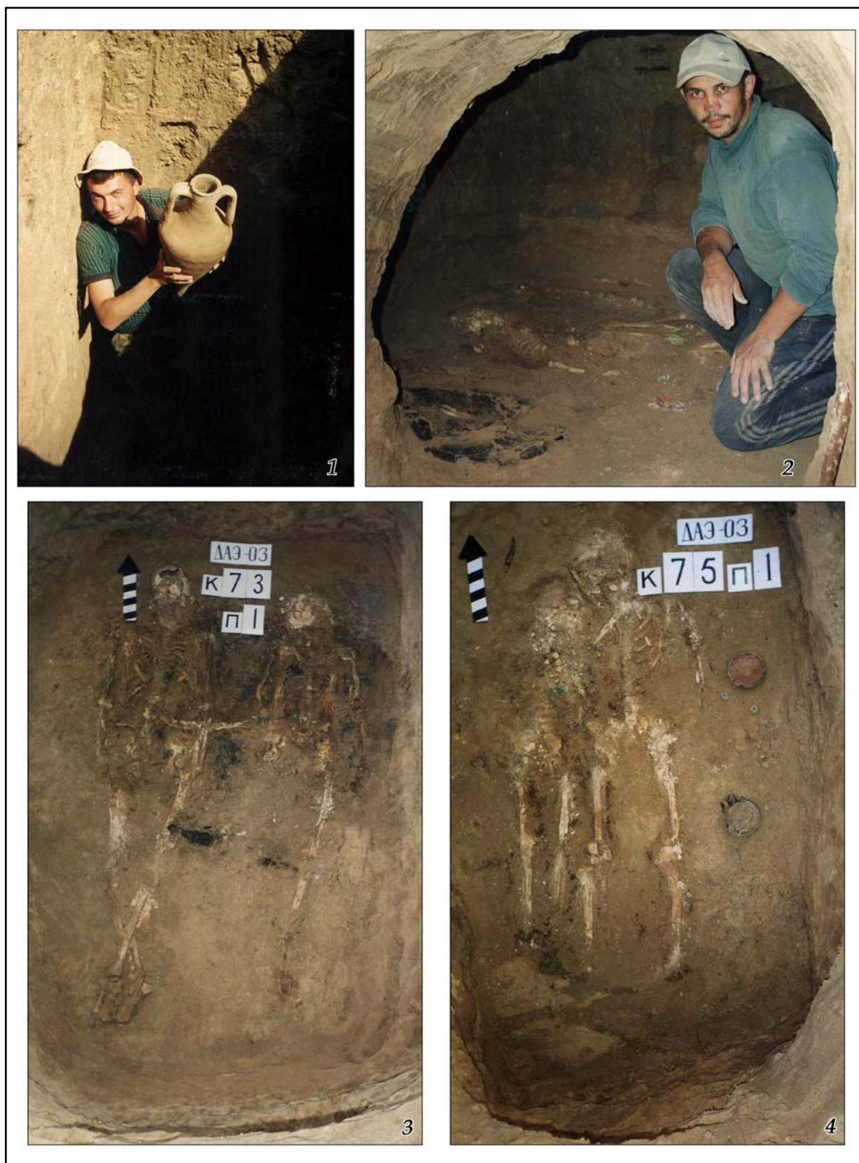
Рис. 10. Раскопки могильника у с. Глиное в 2003 г.: 1 — В.С. Синика с амфорой из погребения 71/1; 2 — И.А. Четвериков в процессе расчистки западной камеры захоронения 76/1; 3 — погребение 73/1 после расчистки; 4 — захоронение 75/1 после расчистки.