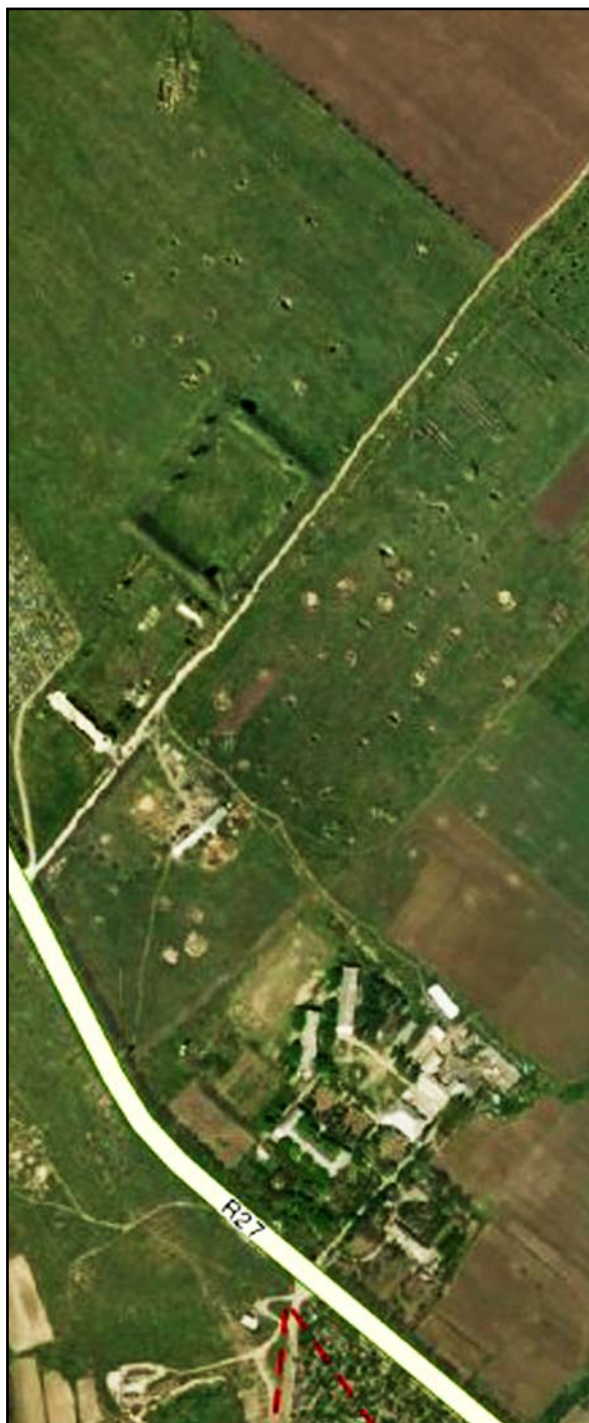
Рис. 11. Незасыпанные раскопы над катакомбами могильника у с. Глиное в 2005 г. (спутниковый фотоснимок www.geoportal.md . Дата обращения 05.12.2015).