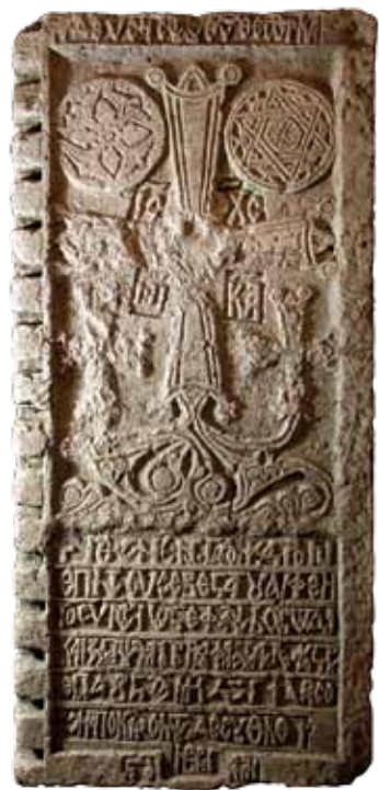
V. Закладная плита 1440 г.

им. А.Д. Ксенопола (Яссы), который координировал работу Музея истории Молдовы до 1968 г. После 1990 г., Отдел был трансформирован в Ясский Институт археологии Академии наук Румынии. Какие-либо детали относительно авторов фото из Аккермана или самих изображений неизвестны, за исключением информации из реестра или, в некоторых случаях, пометок на оборотной стороне фотографий.