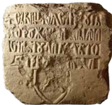
II. Закладная плита 1454 г.

Начиная с 1859 г., в крепости активизируется процесс разборки древних кладок на строительные нужды. В начале 1860-х гг. напротив северного устья рва из этих стройматериалов (как предполагают некоторые эксперты) сооружен каменный причал РОПиТ (Швальбина 1970: 15).