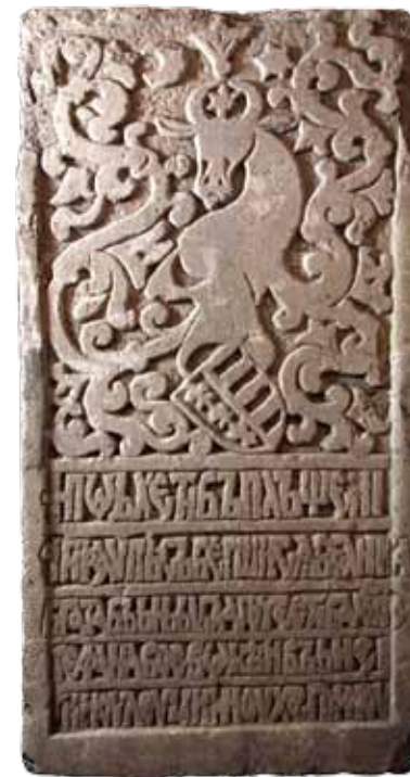
VI. Закладная плита 1484 г.

Год спустя румынский исследователь А. Лапедату обращается к гравюрам и пейзажной фотографии рубежа XIX—XX вв., как новому источнику для изучения крепостной архитектуры Белгорода. В двух кратких сообщениях он опубликовал и проанализировал восемь широко известных в то время