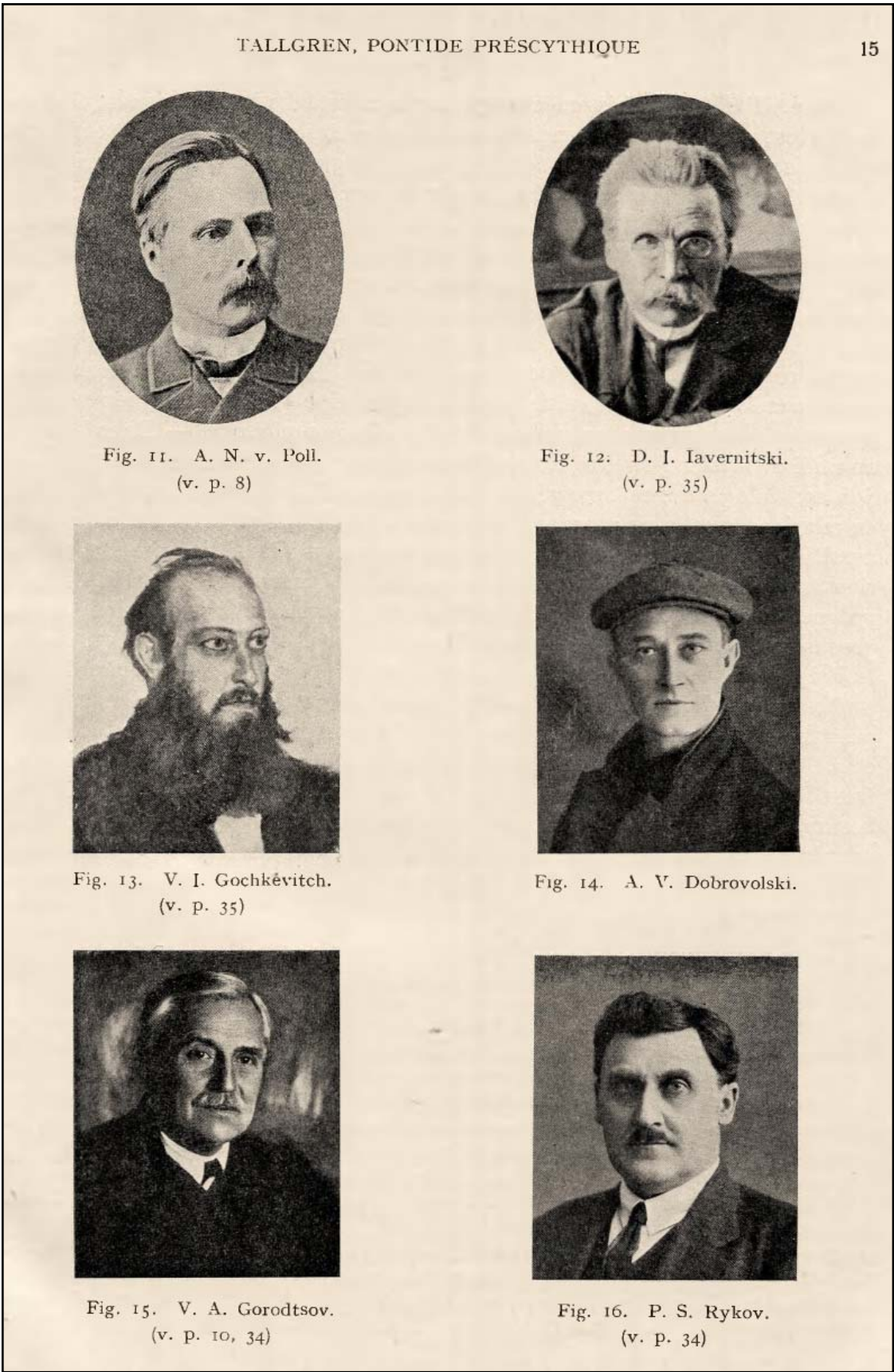
Рис. 4. Исследователи бронзового века Северного Причерноморья (по Tallgren 1926: 15).