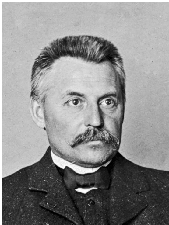
Рис. 2. Василий Алексеевич Городцов. 1905 г. (ОПИ ГИМ).