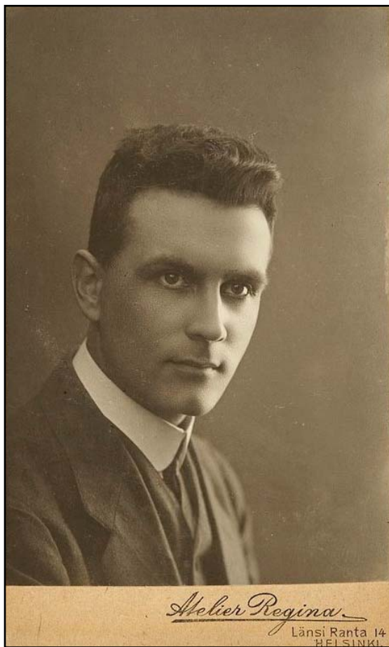
Рис. 1. Арне Михаэль Тальгрэн в начале научного пути, 1910-е годы.