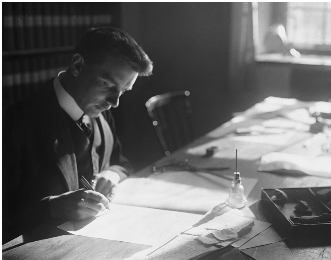
Рис. 3. Арне Михаэль Тальгрэн в рабочем кабинете, 1920-е г..