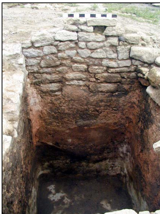
Рис. 2. Тиритана, южная цистерна рыбозасолочного комплекса КРЦ 15. Фото 2005 г.