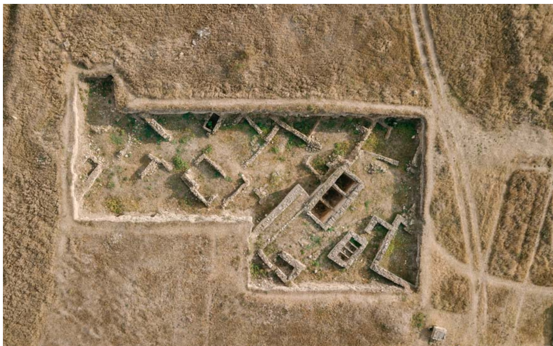
Рис. 1. Тиритана, раскоп XXVI. Вид сверху. Фото 2018 г.