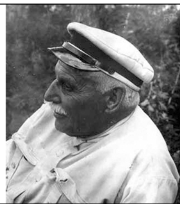
Василий Алексеевич Городцов