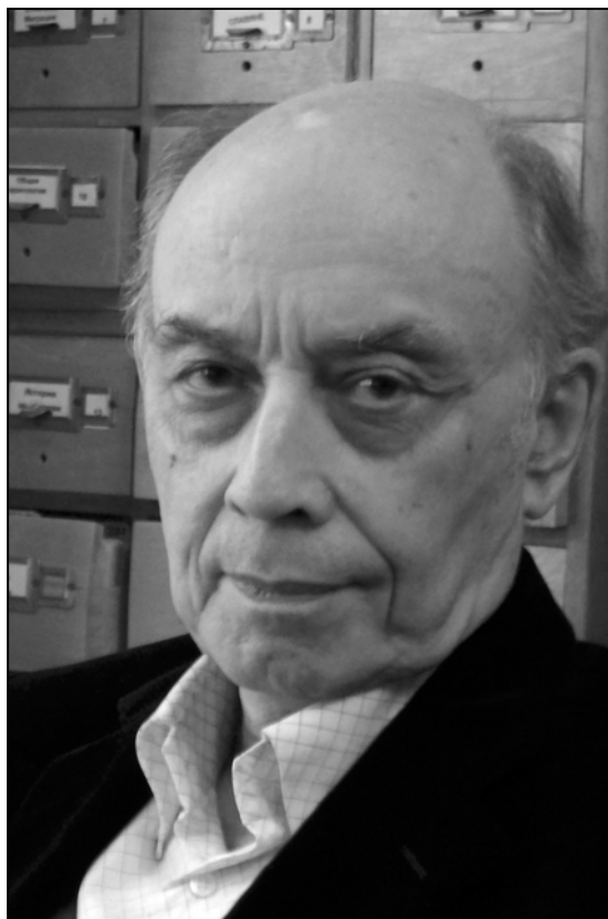
Лев Самуилович Клейн