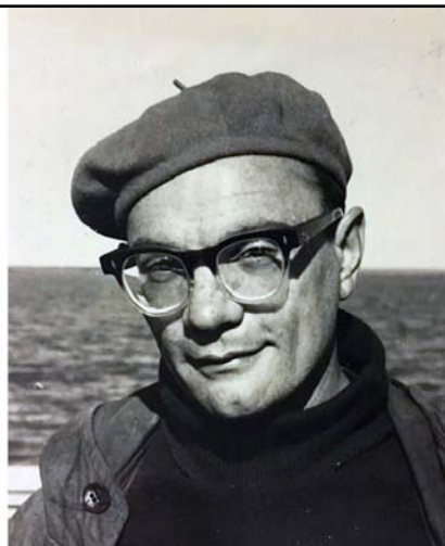
Леонид Павлович Хлобыстин