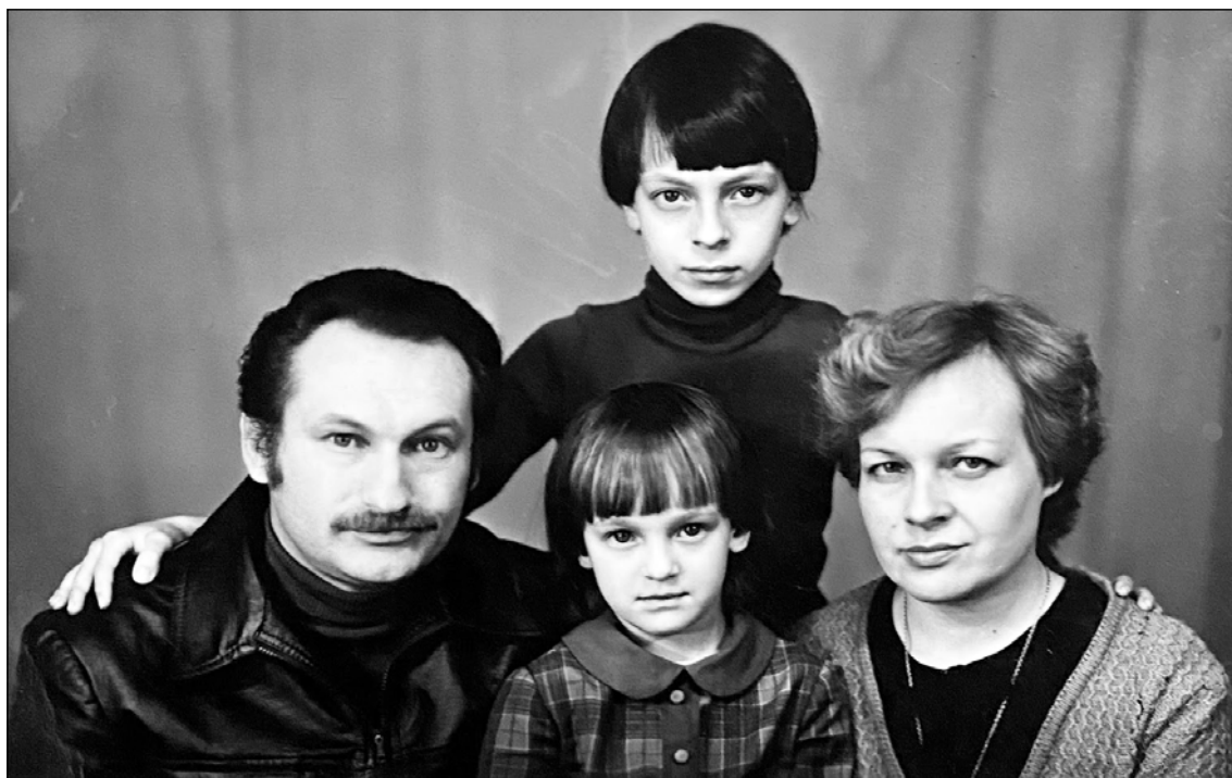
В.Я. Гросул с супругой и детьми, 1981 г.