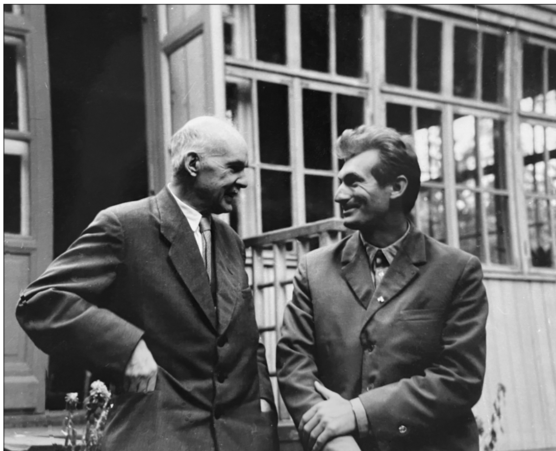
В.Я. Гросул с академиком Н.М. Дружининым, 60-е гг.