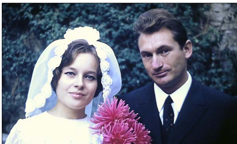
Свадьба, 1970 г.