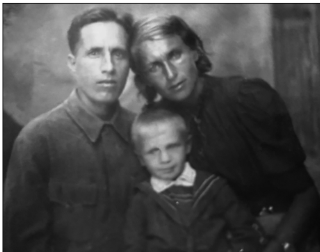
С родителями в эвакуации, Кызылорда, 1943 г.