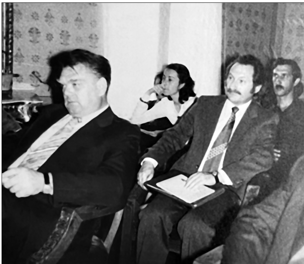
На ученом совете, 80-е гг.