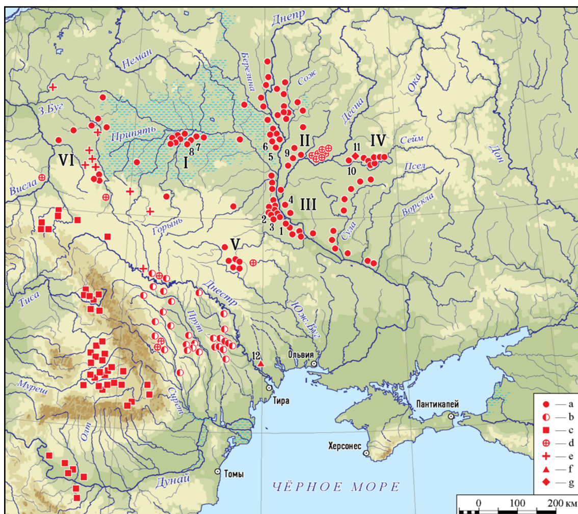
Рис. 1. Карта памятников зарубинецкой культуры (а, I–VI). I — полесский вариант; II — верхнеднепровский; III — среднеднепровский; IV — памятники типа Харьевки; V — южнобугский (?); VI — зарубинецкие памятники на территории Польши (?). (b — памятники культуры Поенешти–Лукашевка; c — латенские памятники; d — находки гривен-корон (Kronenhalsringe); e — памятники с ясторфскими материалами; f — Глиное; g — Мутин. 1 — Зарубинцы; 2 — Корчеватое; 3 — Пирогов; 4 — Вишенки; 5 — Чаплин; 6 — Горошков; 7 — Велемичи I и II; 8 — Отвержики; 9 — Высокий Груд; 10 — Литвиновичи-3; 11 — Мутин; 12 — Глиное.

Fig. 1. Map the sites of the Zarubintsy culture (a, I–VI). I — version of the Polesye; II — version of the Upper Dnieper; III — version of the Middle Dnieper; IV — sites of Kharyevka type; V — version of the South Bug (?); VI — Zarubintsy sites in territory of Poland (?). (b — sites of the Poeneshti-Lukashevka culture; c — sites of the Latène culture; d — finds of crown-shaped torque (Kronenhalsringe); e — sites with materials of the Jastorf culture; f — Glinoe; g — Mutin. 1 — Zarubintcy; 2 — Korchevatoye; 3 — Pirogov; 4 — Vishenki; 5 — Chaplin; 6 — Goroshkov; 7 — Velemichi I and II; 8 — Oтверzhichi; 9 — Vysokii Grud; 10 — Litvinovichi-3; 11 — Mutin; 12 — Glinoe.