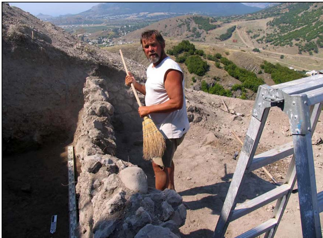
Рис. 3. Таракташ. 2006.