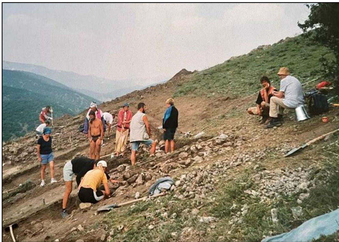
Рис. 2. Начало раскопок на Таракташе, 2002.