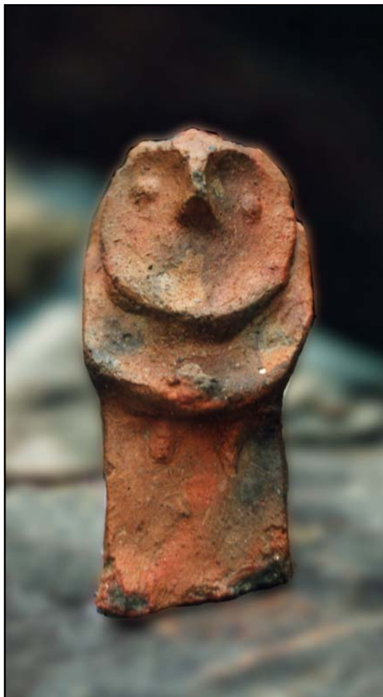
Рис. 5. Таракташский идол.