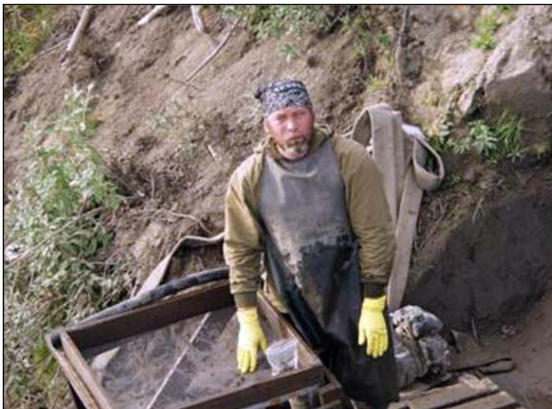
Рис. 6. На раскопках паллеолитической стоянки на р. Яне. Северная Якутия, 2004.