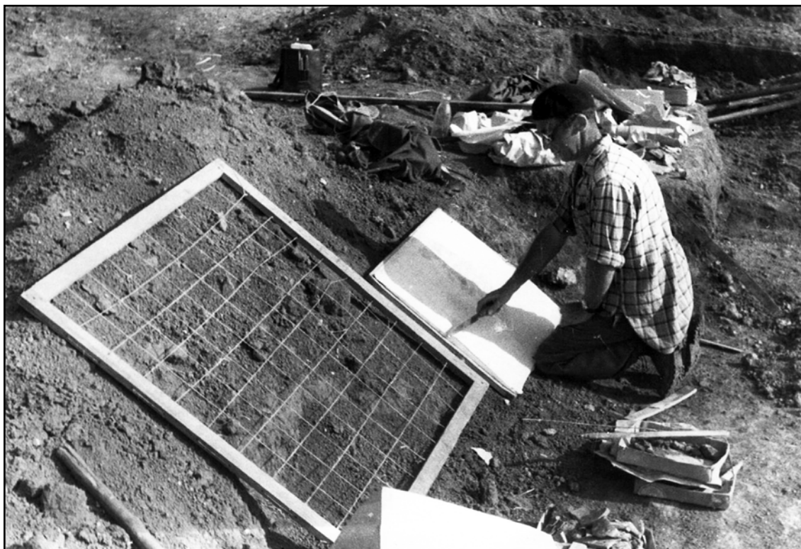
Фото 3. 1950 г. Старый Орхей. Фиксация культурного слоя на раскопе.

пришлось читать, кроме истории, географию, ботанику, математику и французский язык. Но душа к учительству не лежала, а рвалась к великим исследованиям и открытиям. И он совершил рискованный поступок — бросил всё: школу, учеников, трудовую книжку — и вернулся в Кишинёв с единственной целью: заняться научной деятельностью.