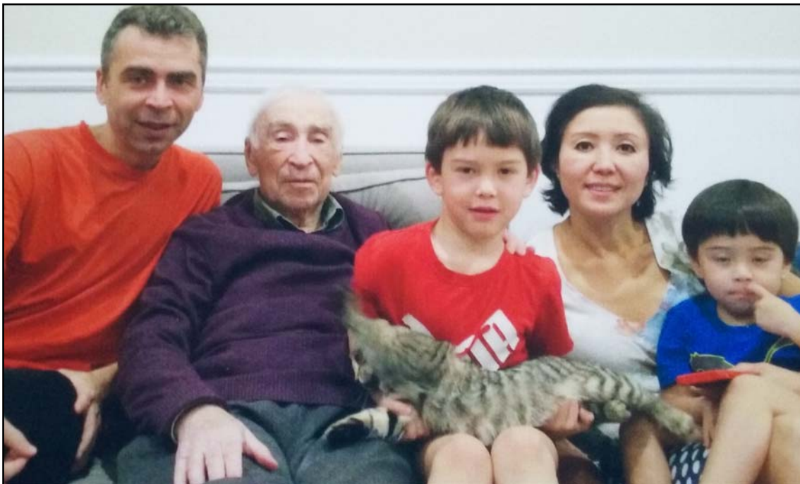
Фото 11. 2016 г., декабрь. Нью-Джерси. Три поколения Полевых за океаном.

и весом не менее 1,5 кг обладает огромным содержательным объёмом. В книге нашли вечное пристанище имена тысяч людей, оставивших яркий след в советской, российской и мировой науке и культуре».