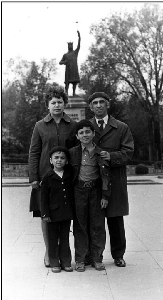
Фото 8. 1980 г. Кишинёв. С семьей у памятника Стефану Великому.

землях, вошедших в границы Молдавского княжества. В работе показаны историко-географические условия начальных этапов развития страны, дана характеристика расселения разных групп сельских жителей. Исследуется формирование первоначальной сети молдавских городов, занятия и этнический состав населения, вопросы внутренней колонизации и хозяйственного освоения земель в связи с природной средой, развитие внутренних и внешних хозяйственных связей.