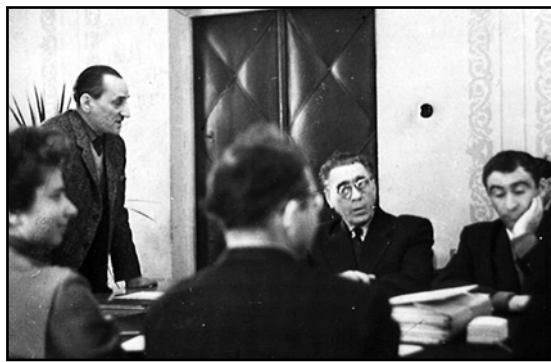
Фото 7. 1965 г. Кишинёв. В дирекции Института истории.