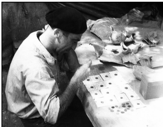
Фото 4. 1957 г. Старый Орхей. Изучение монет — важная часть работы.

но», — усмехался он. Он их не знал, но заинтересованный и талантливый человек мог без большого труда разобраться в написанном. А Юзя, безусловно, был талантливым.