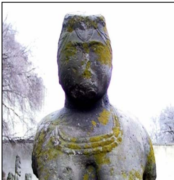
Рис. 12. Нагрудные украшения половецкой каменной бабы. Вторая половина XII — первая треть XIII в. Днепропетровский национальный исторический музей им. Д. И. Яворницкого ( http://www.adsl.kirov.ru/projects/articles/2012/01/03/kamennye-baby/ ).

Fig. 12. Breast jewelry of a Polovtsian stone woman. The second half of the 12 th — the first third of the 13 th century. Dnepropetrovsk National Historical Museum ( http://www.adsl.kirov.ru/projects/articles/2012/01/03/kamennye-baby/ ).