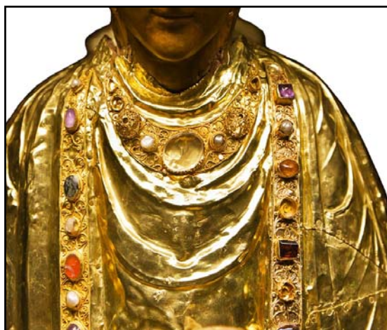
Рис. 11. Нагрудные украшения Богоматери с Младенцем (так называемой «Большой Золотой мадонны», созданной до 1022 г.). Золото, камни, жемчуг. 1220/1230. Музей Собора, Хильдесхайм ( http://www.raymond-faure.com/Hildesheim/Hildesheimer_Domschatz.html ).

Fig. 9. Our Lady of Tenderness. Ceramic icon. The beginning of the 13 th century. National Museum of the History of Ukraine (after Архипова 2017: 64, рис. 2: 1).