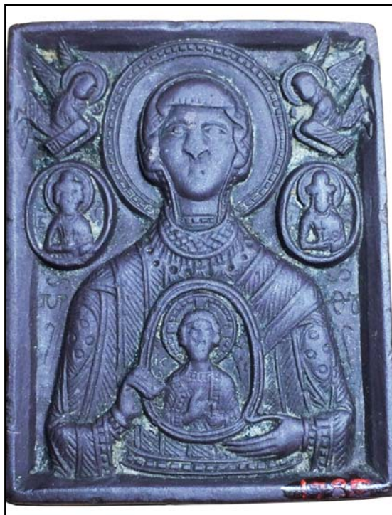
Рис. 10. Богоматерь Никопея. Резная каменная иконка. Первая треть XIII в. ГРМ (по Рындина 1979: 608, № 15).

Fig. 8. Our Lady Oranta, a copper cast small icon from V. and B. Khanenko's collection. Location unknown (after Ханенко 1902: 399, табл. XIII).