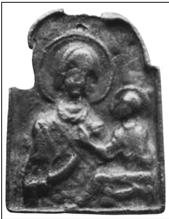
Рис. 6. Богоматерь с Младенцем. Меднолитая иконка. Первая половина XIII в. ЦМиАР (по Стерлигова 2000: 155, ил. 49).

Fig. 7. St. Nicholas. Carved stone icon from V. and B. Khanenko's collection. Location unknown (after Ханенко 1907: 44, табл. XXXVIII, no. 1325).