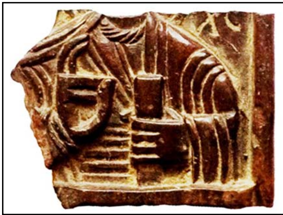
Рис. 5. Христос Пантократор. Каменная иконка. Первая половина XIII в. ГЭ (по Пескова 2012: 186, 200, ил. 8: 7).

Fig. 5. Christ Pantocrator, a small stone icon, first half of 13 th century. State Hermitage Museum, St. Petersburg (after Пескова 2012: 186, 200, ил. 8: 7).