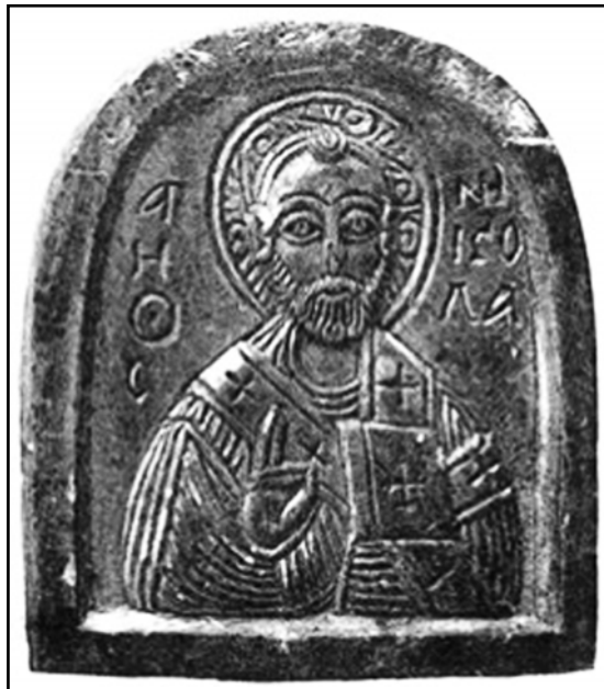
Рис. 7. Святитель Николай. Каменная иконка из собрания В. Н. и Б. И. Ханенко. Местонахождение неизвестно (по Ханенко 1907: 44, табл. XXXVIII, № 1325).

Fig. 5. Christ Pantocrator, a small stone icon, first half of 13 th century. State Hermitage Museum, St. Petersburg (after Пескова 2012: 186, 200, ил. 8: 7).