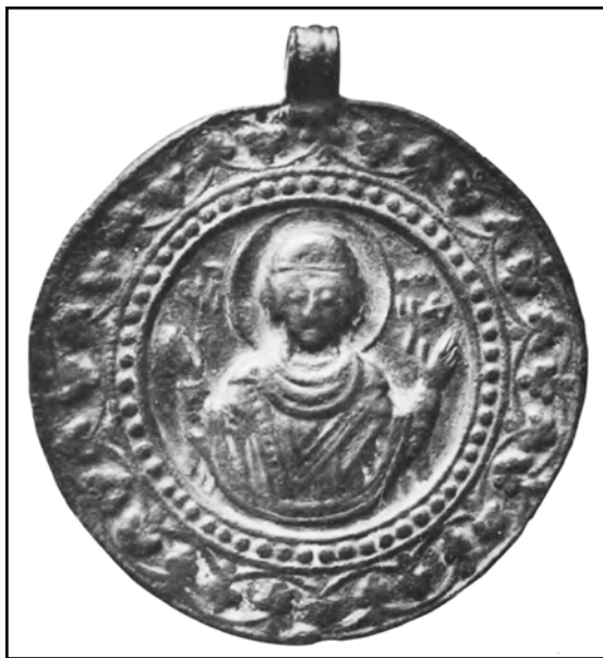
Рис. 8. Богоматерь Оранта (?). Изображение на лицевой стороне меднолитой иконки из собрания Б. И. и В. Н. Ханенко. Местонахождение неизвестно (по Ханенко 1902: 399, табл. XIII).

Fig. 8. Our Lady Oranta, a copper cast small icon from V. and B. Khanenko's collection. Location unknown (after Ханенко 1902: 399, табл. XIII).