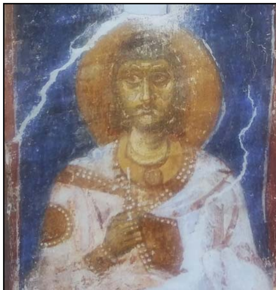
Рис. 4. «Гривна цвирва» святого Иоанна. Деталь фрески Спасской церкви Евфросиниевского монастыря в Полоцке. Середина XII в. (по Сарабьянов 2016: 257, ил. 258).

Драгоценные украшения, как и расшитые жемчугом одеяния святых, согласно византийской традиции, являлись символами их небесной славы. Можно предположить, что в домонгольской Руси эта традиция приобрела более конкретные, осязаемые формы. Поклонение чудотворным иконам, принесение им драгоценных даров здесь стало связываться с «прикладыванием» к ним самых престижных и статусных украшений знати — гривен и монист, обиходных, или же созданных специально для иконы (Стерлигова 2000: 151—160; 2015). Наиболее ранние сведения о вложенных в храмы гривнах мы находим в Киево-Печерском патерике. Тысяцкий Георгий, сын варяга Шимона, приложившего золотой венец к образу Христа, по данному отцу обету вложил в монастырь массивную золотую гривну «яже носаша сий» (Патерик 1911: 63, 190). Если документальные сведения о возложении золотых гривен не просто в монастырь, а на иконы, дошли до нас с конца XIII в. (Ипатьевская летопись 1998: 927), то их изображения в образах есть уже в первой трети XIII в. К этому