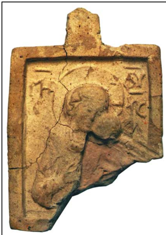
Рис. 9. Богоматерь Умиление. Керамическая иконка. Начало XIII в. НМИУ (по Архипова 2017: 64, рис. 2: 1).

Fig. 10. Our Lady Nicopoea. Carved stone icon. The first third of the 13 th century. The State Russian Museum (after Рындина 1979: 608, № 15).