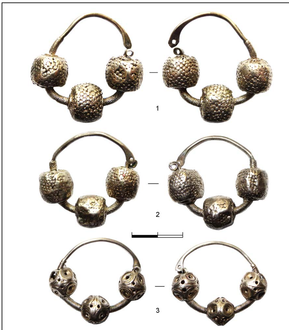
Рис. 1. Трехбусинные кольца (КПЛ-М-10526, 10527, 10529).