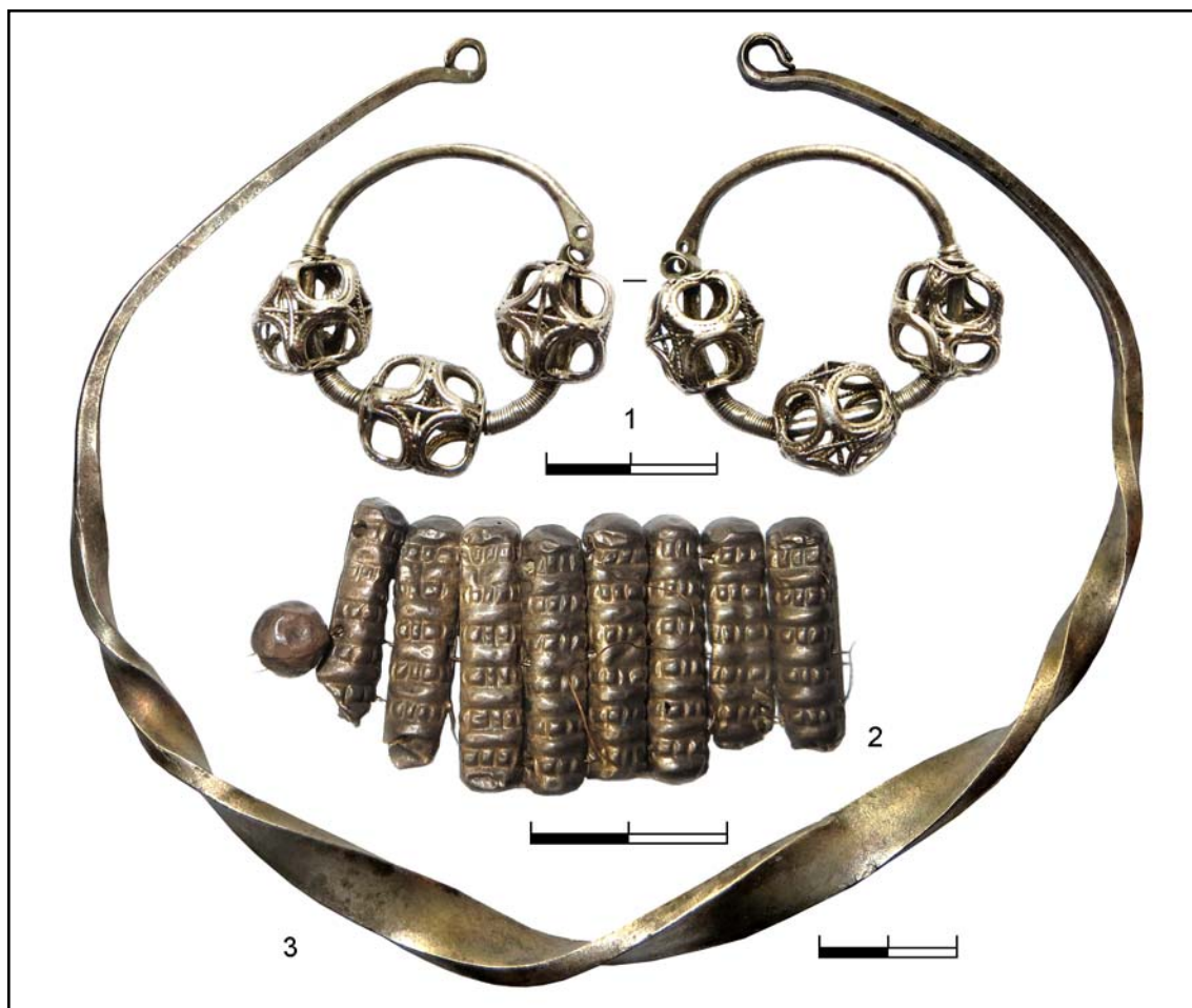
Рис. 3. 1 — трехбусинное кольцо (КПЛ-М-10528); 2 — фрагмент рясен (КПЛ-М-10532); 3 — шейная гривна (КПЛ-М-10522).