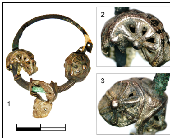
Рис. 2. 1 — трехбусинное кольцо (КПЛ-М-10530); 2, 3 — бусины с прорезями (фото автора).

Что касается других предметов ювелирного убора, нельзя исключать, что эти вещи были переданы из музея Киевского церковно-археологического общества в числе почти 3000 экспонатов, о которых сохранились некоторые сведения (Каталог... 2002: 21). Какое-то количество из них было распознано, но большую часть, в первую очередь, археологической и нумизматической коллекций, по разным причинам невозможно идентифицировать (Каталог... 2002: 22). Например, в «Указателе Церковно-археологического музея» (ЦАМ) за 1897 г. среди «археологических предметов разных украшений», поступивших из собрания действительного статского советника Н.А. Леопардова, упоминаются киевская серебряная шейная гривна, а также шейная серебряная витая гривна и серебряный браслет с расширенными концами, найденные в Киеве на Маложитомирской улице (Петровъ 1897: 266, 268, 269). 2 серебряных шейных обруча, найденных в 1888 г. в деревне Лудошурской Вятской губернии, переданы в ЦАМ Императорской Археологической комиссией (Петровъ 1897: 225). Также нужно учитывать, что пополнение коллекций музея осуществлялось до прекращения его фактической деятельно-