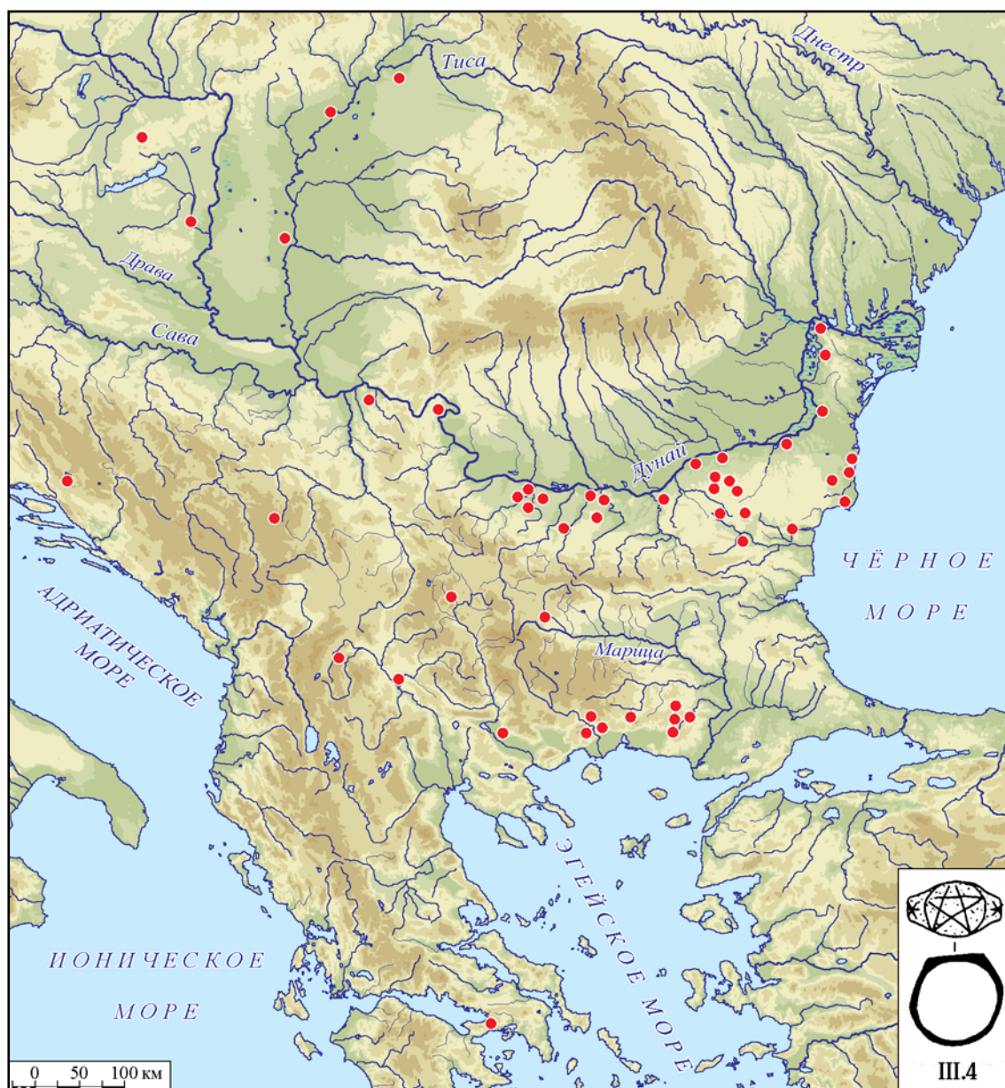
Рис. 4. Карта распространения перстней с пентаграммой, тип III.4, в Болгарии (по Григоров 2007: обр. 84: III.4).