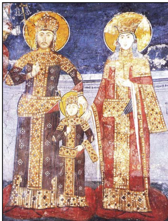
Рис. 2. Царь Душан с женой Еленой и малолетним сыном Урошем. Монастырь Дечаны, 1340 г., фреска (по Благојувић 1989: 146, фрагм.).

На рубеже XII—XIII вв. Неманичи вначале стали носить также и одежду византийского образца (Радойчић 1996: 80): белую тунику, узкий длинный дивитисий («багрьница», «чръвьница») из плотной материи с нашитыми по центру, подолу и на предплечьях широкими полосами драгоценной ткани, орнаментированными драгоценными камнями и жемчугом. Лор, первоначально крестообразно обвивавший торс властителя, в XIII в. разделился на широкий воротник («манијак», «колларинь»), вертикальную полосу, за которой сохранилось название «лор» (впоследствии превратившуюся в обшивку полочек) и широкий пояс, с прикрепленным к нему концом из более легкой материи, в Византии называвшийся форакионом (Радойчић 1996: 82). От-