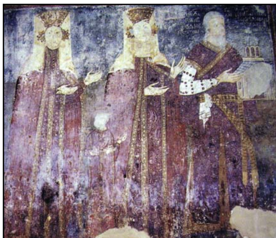
Рис. 3. Семейство жупана Брайана Ростиславича. Церковь деревни Карану около Ужице, 1340—1342 гг., фреска (по Јовановић 2011: 122).

Fig. 3. The family of župan Brian Rostislavich. Church of the village of Karanu near Uzice, 1340—1342, fresco (after Јовановић 2011: 122).