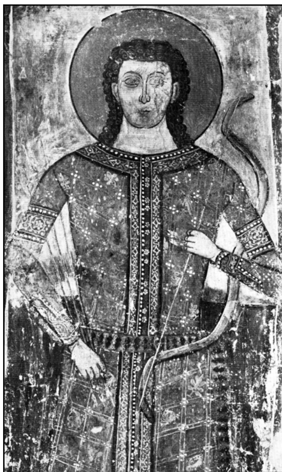
Рис. 7. Портрет неизвестного князя конца XIV в. Церковь Введения Богородицы в Велуче, фреска, фрагмент (по Гаврилович 1980—1993, 2: ил. 30).

Мужской кафтан, аналогичный костюмам вельмож из Псачи, запечатлен на портрете неизвестного князя конца XIV в. (церковь Введения Богородицы в Велуче) (Гаврилович 1980—1993, 2: ил. 30) (рис. 7). Более крупная, хотя и черно-белая фотография позволяет рассмотреть дополнительные нюансы костюма, прежде всего его ткань, которая оказывается не однотонной, а узорчатой. Застежка кафтана сделана отнюдь не встык, как это показалось на предыдущем, более мелком изображении, а с небольшим перехлестом слева направо. При этом центральная часть вертикальной полосы (более темная) должна быть пришита к левой полочке, что подтверждается линиями рисунка. Соответственно, к правой полочке должна быть пришита сходная по ширине полоса, которая перекрывается и становится невидимой. Ровно по центру средней (темной) полосы нарисованы небольшие цветочки, собран-