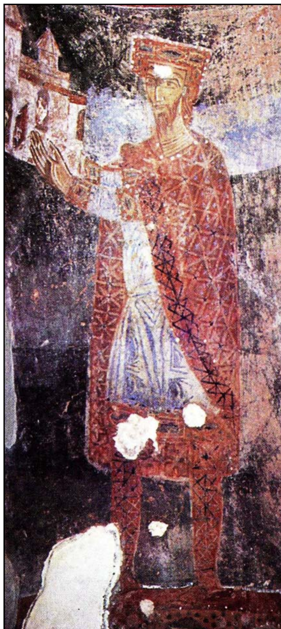
Рис. 1. Зетский король Михаил. Церковь Св. Михаила в Стону, 1080 г., фреска (по Гаврилович 1980—1993, 1: цв. ил. V).

Рассмотрим выбранные изображения в хронологическом порядке. К числу наиболее ранних из сохранившихся до нашего времени изображений, относится портрет зетского короля Михаила 3 (Церковь Св. Михаила в Стону, 1080 г.) (рис. 1) (Гаврилович 1980—1993, 1: цв. ил. V; Радойчић 1996: цв. ил. I). Король запечатлен в рост, что позволяет рассмотреть его полный костюм: голубого цвета подпоясанную тунику, обрамленную по подолу, на запястьях и предплечьях узорчатой тесьмой, частично видимое широ-