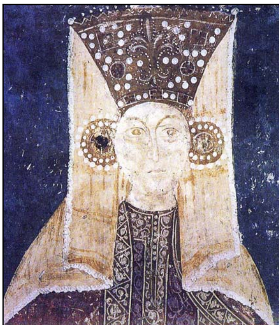
Рис. 4. Одна из дочерей жупана Брайана Ростиславича. Церковь деревни Карану около Ужице, 1340—1342 гг., фреска, фрагмент (по Благојувић 1989: 189).

Fig. 4. One of the daughters of župan Brian Rostislavich. Church of the Karanu village near Uzice, 1340—1342, fresco, fragment (after Благојувић 1989: 189).