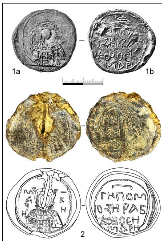
Рис. 1. Печать княгини Марины. Тип 116. 1 — Киев, усадьба Софийского монастыря (1а — по Пескова 2012: 202; 1b — по Булгакова 2003: рис. 7); 2 — Киев, Подол (по Хамайко 2015: рис. 3; 4).