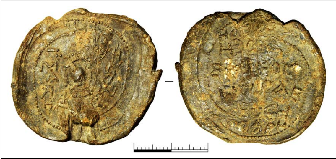
Рис. 2. Печать княгини Марины. Тип 116, вариант 2. Чернигов, раскопки Е.Е. Черненко и А.Л. Казакова, 2007 г. (фото Н.В. Хамайко).