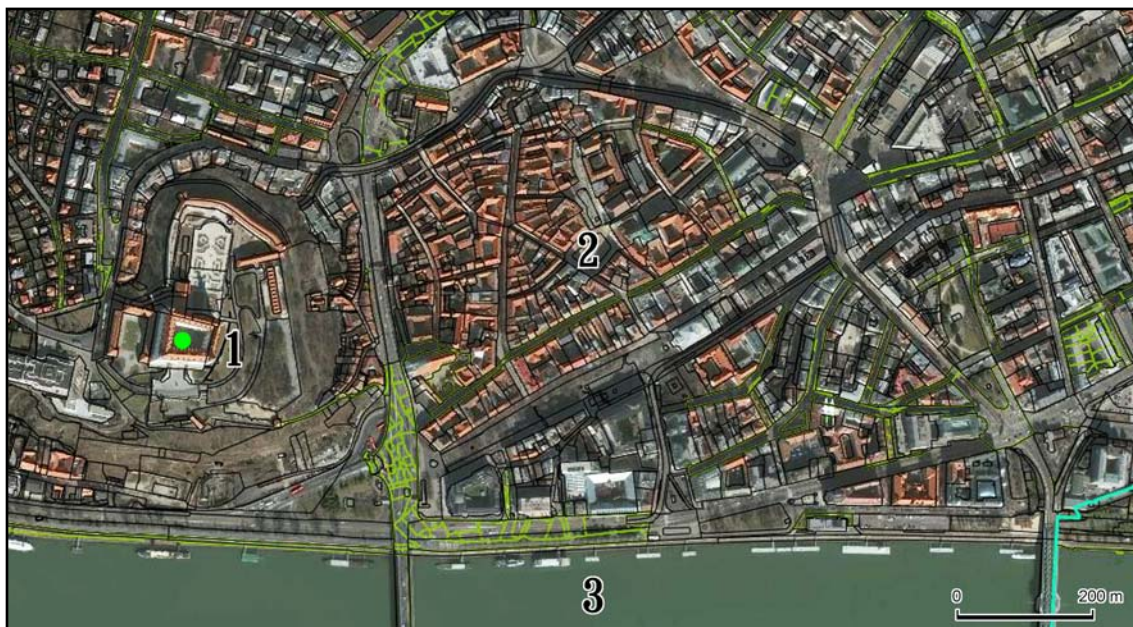
Рис. 4. Братислава, центр: 1 — Братиславский замок, отмечено место находки печати; 2 — исторический центр; 3 — Дунай.