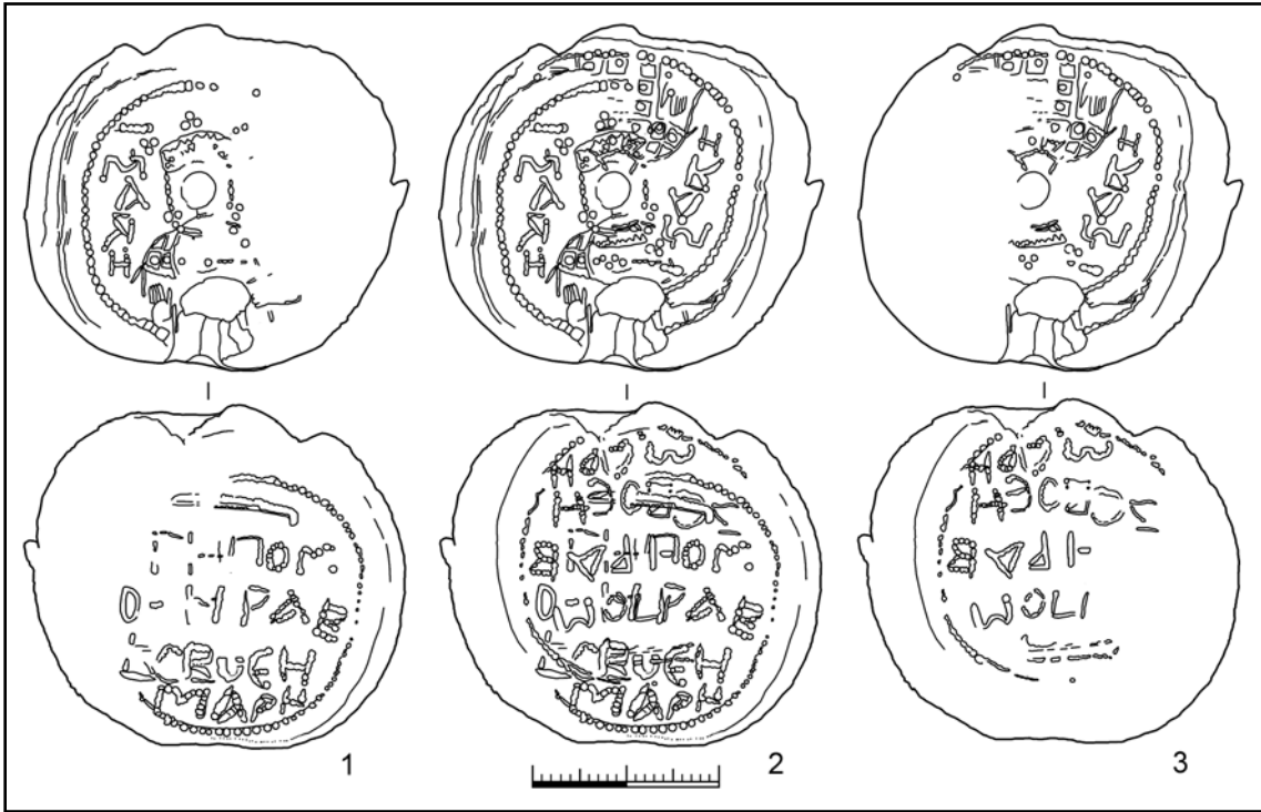
Рис. 3. Печать княгини Марины. Тип 116, вариант 2. Чернигов, раскопки Е.Е. Черненко и А.Л. Казакова, 2007 г. Реконструкция оттисков (рисунок Н.В. Хамайко).