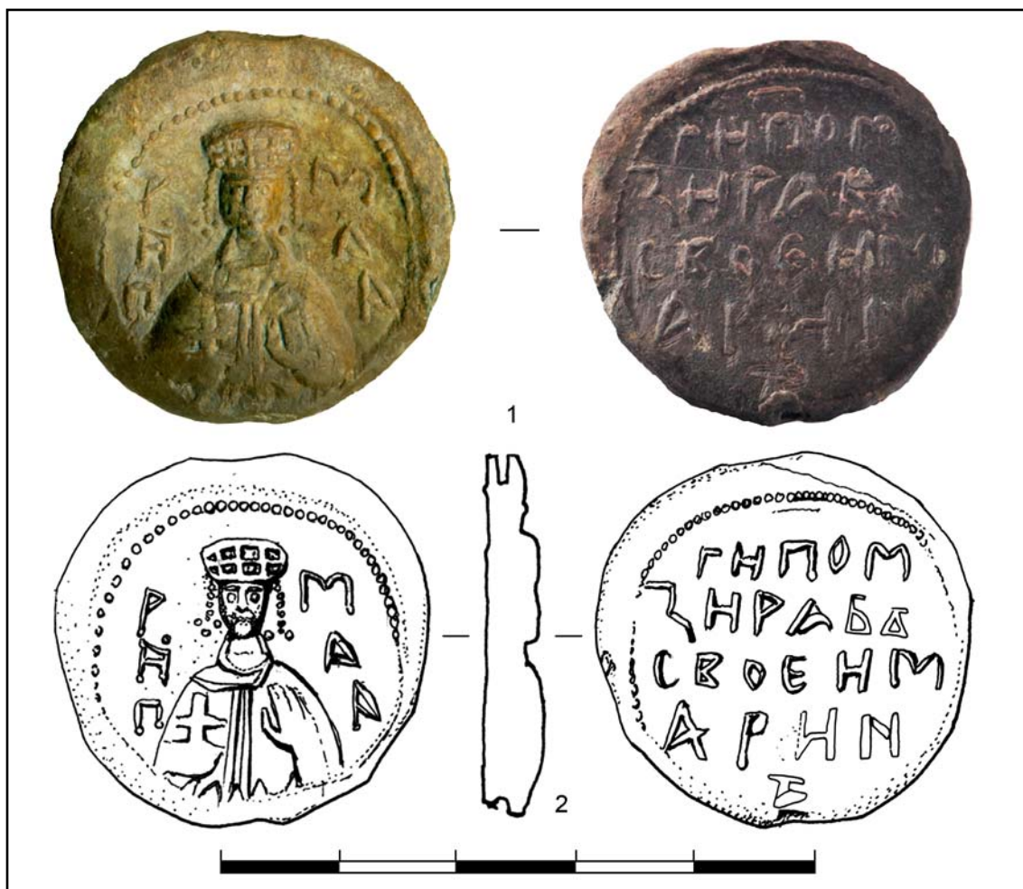
Рис. 7. Печать княгини Марины. Тип 116а. Братиславский замок. Раскопки 2009 г. (2 — рисунок З. Нагевой).