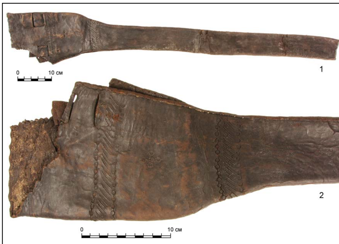
Рис. 1. Чехол для карабина из раскопок Березовского кремля в 2018 г.: 1 — общий вид; 2 — деталь (фото сделано в лаборатории НПО «Северная археология-1»).

Fig. 1. Carabine holster from excavations of the Berezov Kremlin in 2018: 1 — general view; 2 — detail (photo taken in the laboratory of the research and production association “Northern Archeology-1”).