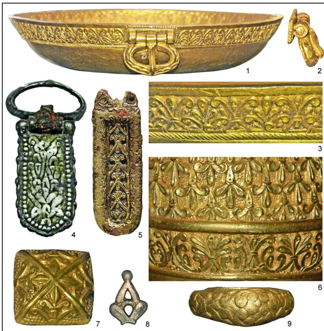
Рис. 3. Стилистические аналогии пряжке из п. 18 Слободзеи. 1—3 — Надьсентмиклошский клад, чаша №20; 4 — п. 18 Слободзеи; 5 — Микульчице; 6, 7 — Преславский клад; 8 — Надьсентмиклошский клад, сосуд №13 (1—3, 6—8 — фото автора; 4 — фото А. Тюрка; 5 — по Dekan 1981: cat. 96).