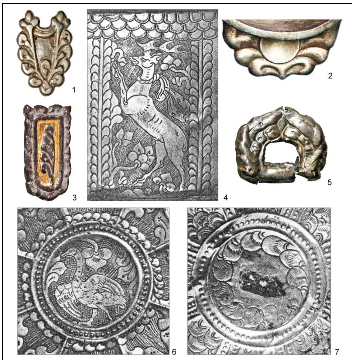
Рис. 2. Исходные стилистические мотивы деталей с цветковым или фасетчатым краем: 1 — Катериновка, к. 32, п. 1-1 (фото автора); 2 — ручка чаши из Стерлитамака (по Ахмеров 1955: табл. II: 1); 3 — Ново-Николаевка; 4 — фрагмент декора ведра из Широково; 5 — Дуба-Юрт, кат. 11; 6, 7 — фрагменты декора блюд из Репьевки (1, 3 — фото автора; 2 — по Мажитов, Сунгатов, Султанова 2008: 9; 5 — по фото А. Тюрка; 4, 6, 7 — по Смирнов 1909: LXXV; LXXVIII: 137; 138).

Fig. 2. Initial stylistic motifs of details with a floral or scalloped edge: 1 — Katerynivka, barrow 32, burial 1-1; 2 — the handle of the bowl from Sterlitamak (after Ахмеров 1955: табл. II: 1); 3 — Novo-Nikolaevka; 4 — decor of a bucket from Shirokovo (fragment); 5 — Duba-Yurt, catacomb 11; 6, 7 — decoration of dishes from Repievka (1, 3 — photo by the author; 2 — after Мажитов, Сунгатов, Султанова 2008: 9; 5 — photo by A. Türk; 4, 6, 7 — after Смирнов 1909: LXXV; LXXVIII: 137; 138).