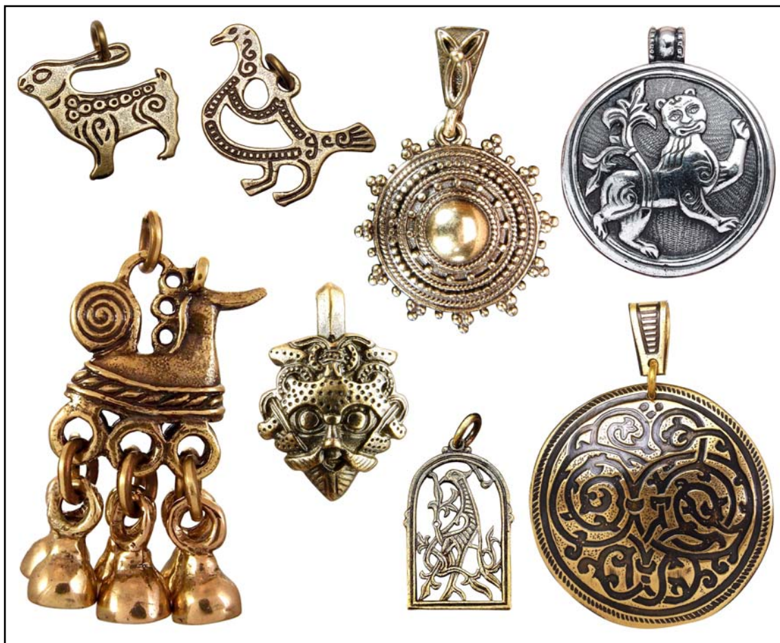
Рис. 6. Подвески.