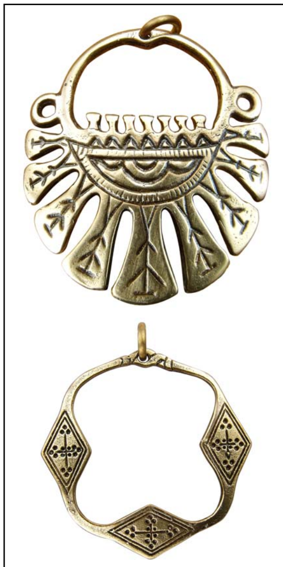
Рис. 2. Височные кольца.

Историческая реконструкция в России появилась как развитие одного из методов экспериментальной археологии, с помощью которого можно было наглядно доказать или опровергнуть теоретические выкладки историков. Историческая реконструкция предполагает воссоздание материальной (одежда, оружие, предметы обихода, продукты питания и пр.) и духовной культуры той или иной исторической эпохи или знаменательного события с использованием археологических, изобразительных и письменных источников. За рубежом это направление досуга и обслуживания его индустрия, насчитывающая уже несколько десятилетий, приобрели устойчивую культурную репутацию, обеспеченную соответствующей инфраструктурой. Исторические реконструкции появились в России в начале 1990-х годов. С тех пор все больше