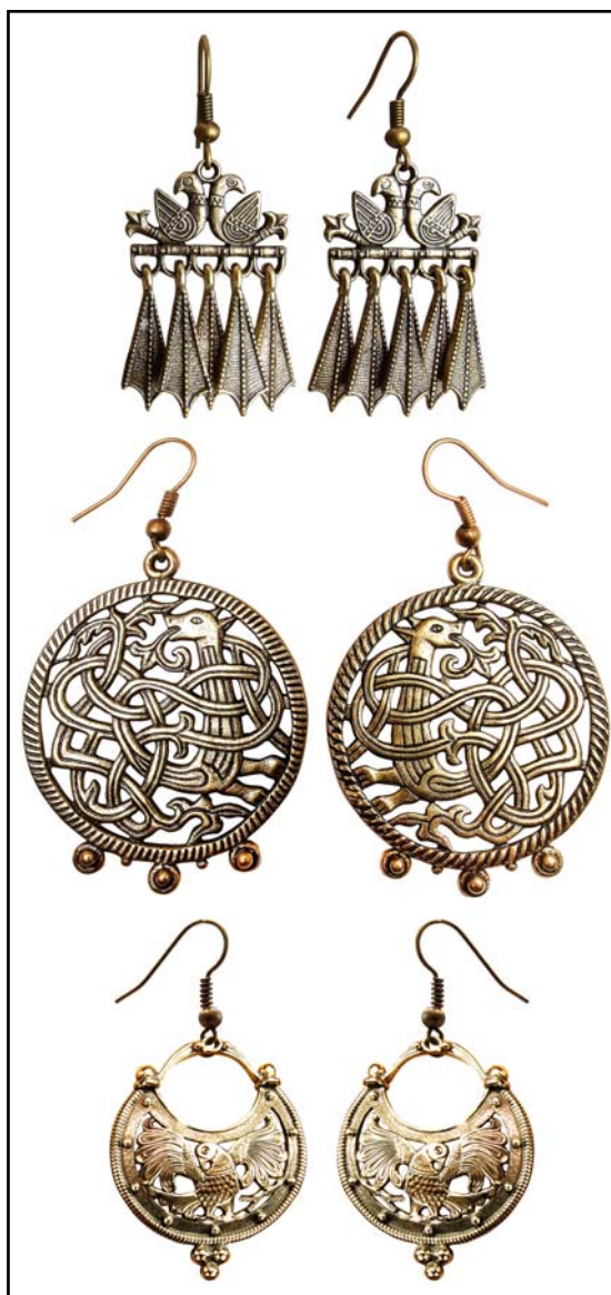
Рис. 5. Серьги.

В качестве примера можно привести работы, представляемые на фестивале «Русский костюм на рубеже эпох» в Ярославле (с 2002 по 2020 гг.), успешно воспроизводящие и в XXI столетии облик традиционной одежды кон. XIX — нач. XX вв. Это коллекции клубов «Русские начала» (Москва), «Истоки» (Астрахань), «с. Усть-Цильма» (Республика Коми), «Традиция» (г. Судогда, Владимирская обл.) и др. (Калашникова 2018). Важно отметить, что украшения к этнографическим реконструкциям выполняются мастерами на основе изучения подлинных, целиком сохранившихся артефактов и поэтому являются не реконструкциями, а своеобразными репликами — внешне похожими, но выполненными из современных материалов, зачастую с использованием новых технологий, иногда в измененных масштабах.