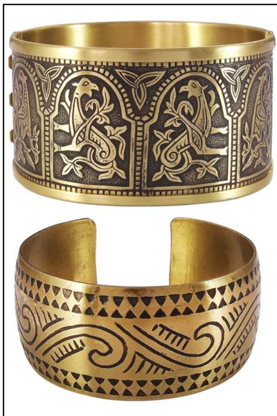
Рис. 4. Браслеты.