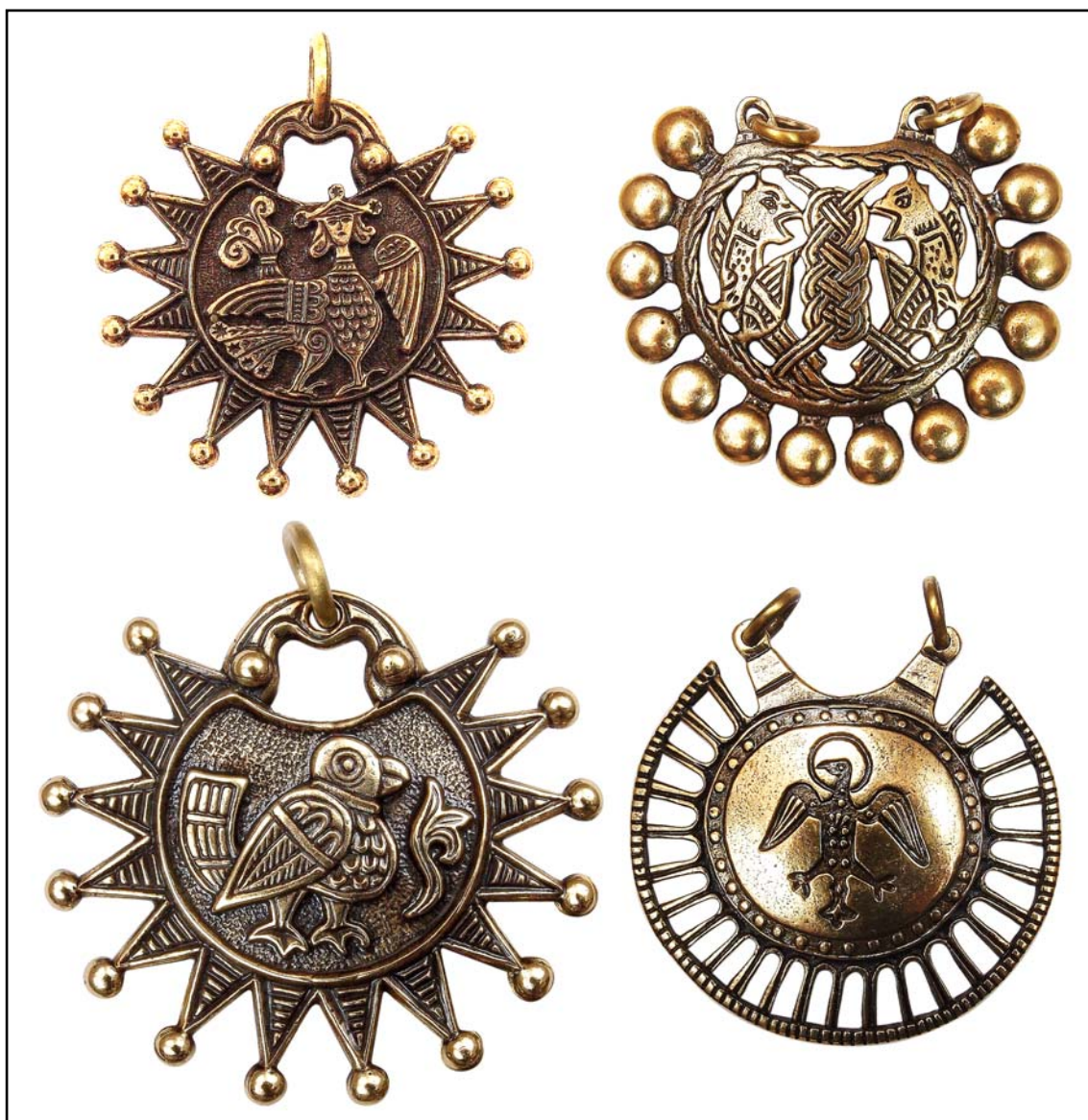
Рис. 3. Колты.