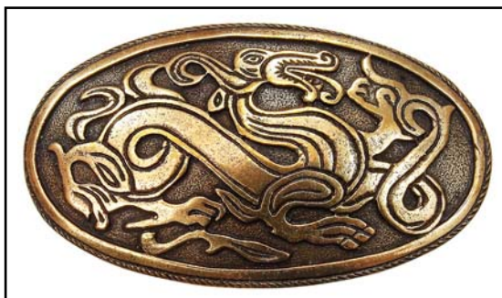
Рис. 7. Брошь.

Украшения-реплики выполняются вручную в технике гравировки, чеканки, вальцовки, тиснения, а в последнее время и спо-