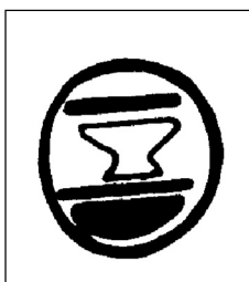
Рис. 4. Мамлюкский герб с булавы из Балабан, по Е.Сава (1996) и Г.Постикэ, Г.Сава (1996).

тырьмя дисками-кружками. Монета принадлежит известному типу (Balog 1964: 314), отнесенному к султану Ал-Музаффар-Саиф ал-дин Хаджи I (1346–1347). Попав в Старый Орхей вместе с восточноисламским населением, размещенным здесь Абдуллахом, она происходит, видимо, из зоны Крыма, который находился в более выгодном (из-за присутствия итальянцев) положении в плане поддержания тесных отношений с сиро-египетским миром. В связи с этим напомним о публикации другой медной мамлюкской монеты Ал-Захир Саиф ал-дин Баркука (1383–1389, 1390–1399) с двумя надчеканками, одна из которых принадлежит генуэзской колонии Каффы (Ilisch 1971).