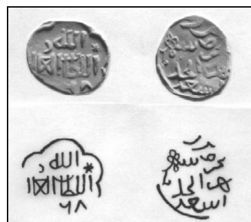
Рис. 1. Серебряная монета, чеканенная в Шехр ал-Джедиде в 768 г.х.

Монета, которую я намерен описать, относится к неопубликованной группе монет из Сесен, находящихся в частной коллекции в Кишиневе. Это серебряная эмиссия (→ 1,1 г; 16 мм), на лицевой стороне которой отсутствует имя хана и читается год хиджры — (7)68. На оборотной стороне помещена обычная легенда «чекан Нового Города хорошо охраняемого», за которой следует еще одно слово, расположенное на маленьком пространстве слева внизу (рис. 1). Предшествующим обобщением (Nicolae 1997) такие экземпляры не зарегистрированы. Тогда мне были известны лишь два экземпляра 768 г.х., оборотные стороны которых были отчеканены другими штемпелями. Обе монеты происходят из части Сесенского клада, предварительно опубликованной А.А.Нудельманом. Хотя на этих экземпля-