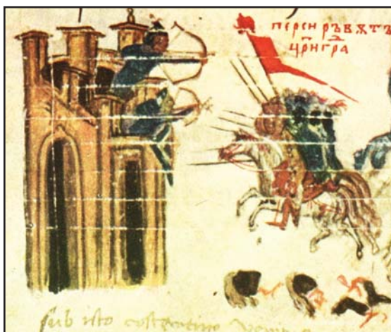
Рис. 1. Оборона крепости в первой половине XIV в. Фрагмент миниатюры из Хроники Константина Манассии (по Дуйчев 1962: 42).

Fig. 1. Defense of the fortress in the first half of the 14 th c. Fragment of the miniature from the Chronicle of Constantine Manasses (after Дуйчев 1962: 42).