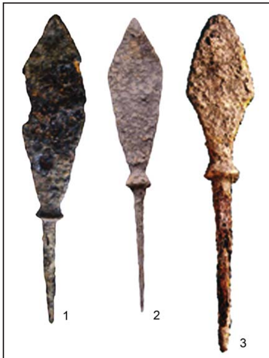
Рис. 5. Наконечники татарских стрел с поля битвы при Русокастро: 1, 2 — веслообразные; 3 — срезень.