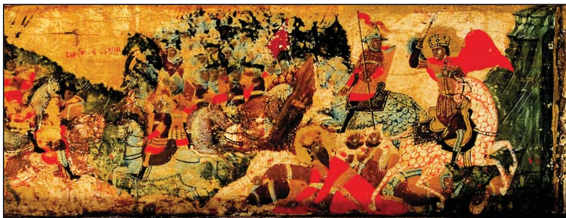
Рис. 3. Битва при Велбужде 1330 г. Фрагмент житийной иконы Св. Стефана Уроша III Дечанского конца XVI в. (по Волощук, Федорук 2014: 23).