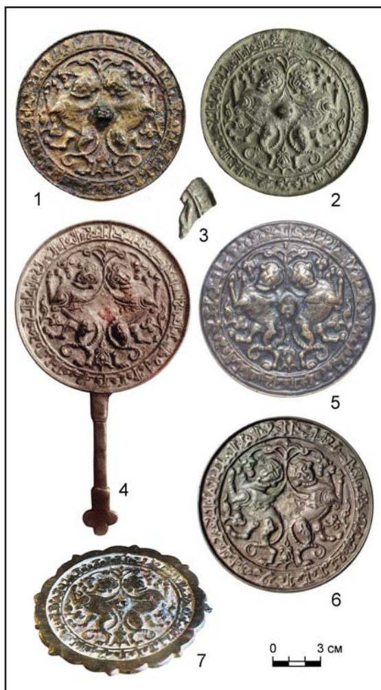
Рис. 2. Бронзовые зеркала с изображениями сфинксов: 1 — городище Донец (по Крупа 2013: 158, рис. 1); 2 — Днепропетровская область; 3 — культурный слой крепости Самари (по Шалобудов 2017); 4 — урочище Бурулдай (Казахстан); 5, 6 — Болгарское городище (по Руденко, Оборин 2017: 153, рис. 1: 1, 3, 4); 7 — Дагестан (по Доде 2010: 89, рис. 51: б).

Fig. 2. Bronze mirrors with images of sphinxes: 1 — Donets fortified settlement (after Крyпа 2013: 158, рис. 1); 2 — Dnipropetrovsk region; 3 — cultural layer of the Samari fortress (after Шалобудов 2017); 4 — Burulday stow (Kazakhstan); 5, 6 — Bolgar hillfort (after Руденко, Оборин 2017: 153, рис. 1: 1, 3, 4); 7 — Daghestan (after Доде 2010: 89, рис. 51: b).