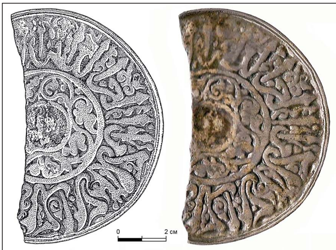
Рис. 1. Бронзовое зеркало из Теи.