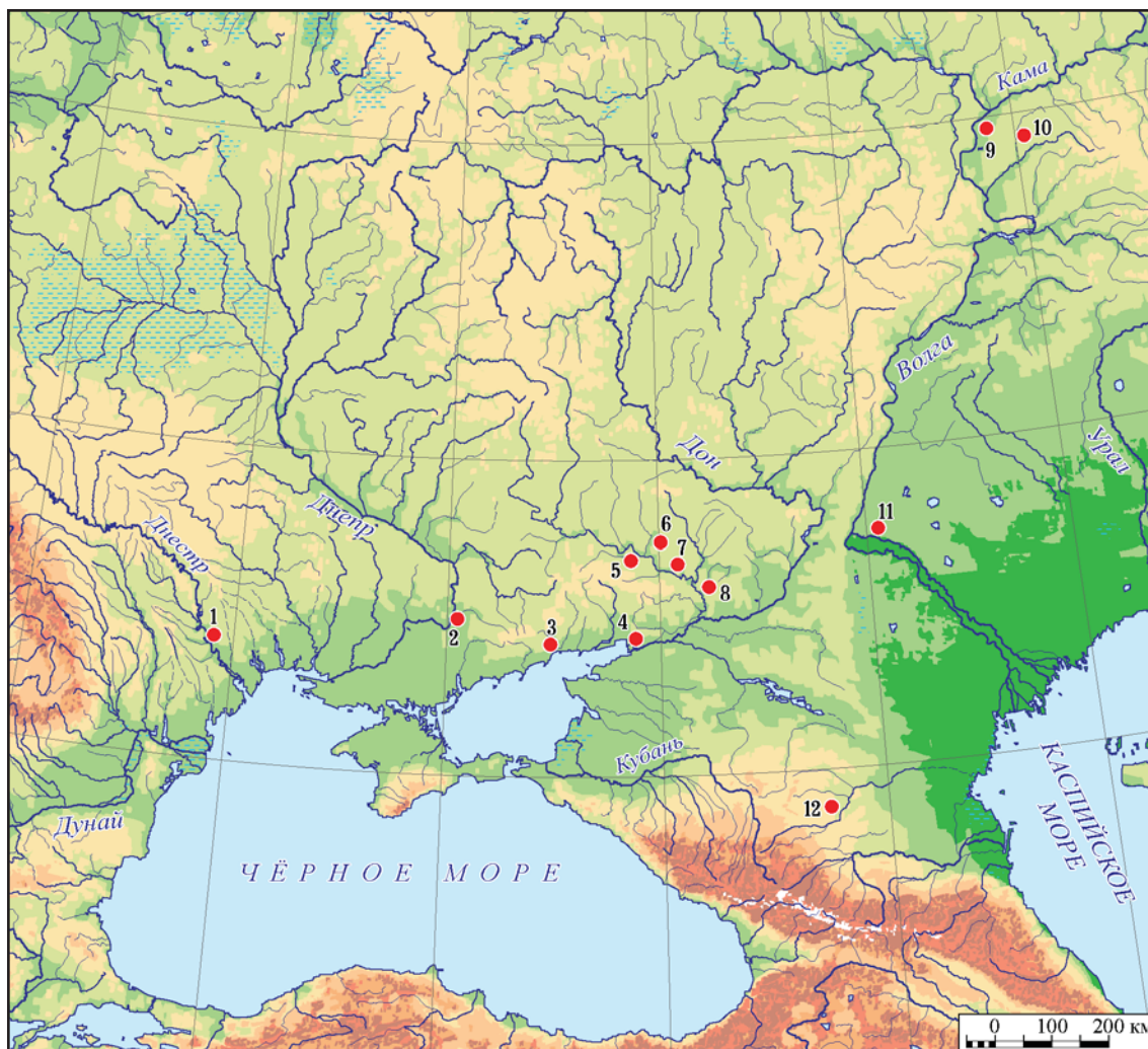
Рис. 3. Ареал распространения бронзовых зеркал с арабской надписью почерком «наскх»: 1 — Тея; 2 — Большие Кучугуры; 3 — Ляпинская балка; 4 — Ливенцовский могильник; 5 — Царино городище; 6 — Нижняя Дуванка; 7 — Передельское; 8 — Белая Калитва; 9 — Болгар; 10 — Торецкое поселение; 11 — Царевское городище; 12 — Новозаведенное-II.

Fig. 2. Bronze mirrors of the Golden Horde time in the Dnieper-Volga interfluve: 1 — Toretskoye settlement (after Ба-лиулина 2016: 149, рис. 3: 1); 2 — Bulgarian fortified settlement (after Полякова 1996: рис. 73: 5); 3 — Tsarevo fortified settlement (after Федоров-Давыдов 1966: 83, рис. 13: CI); 4, 5 — Lyapinskaya Balka burial ground (after Евглевский, Кульбака 2003: 369—371, 395—397, рис. 10: 4—5, 11: 5); 6 — Peredelsky burial ground (after Кравцова, Стадник 2005: 301, рис. 4: 2); 7 — Nizhniya Duvanka (after Трифилев 1905: 132—133, рис. 10); 8 — Belaya Kalitva (after Пьянков, Раев 2004: 220—221, рис. 1: 2); 9 — fortified settlement Bolshie Kuchugury (after Попандопуло, Тихомолова 2007: 28—29); 10 — Novozavedennoe-II (after Волков, Маслов, Петренко 2001: 126—128, рис. 3).