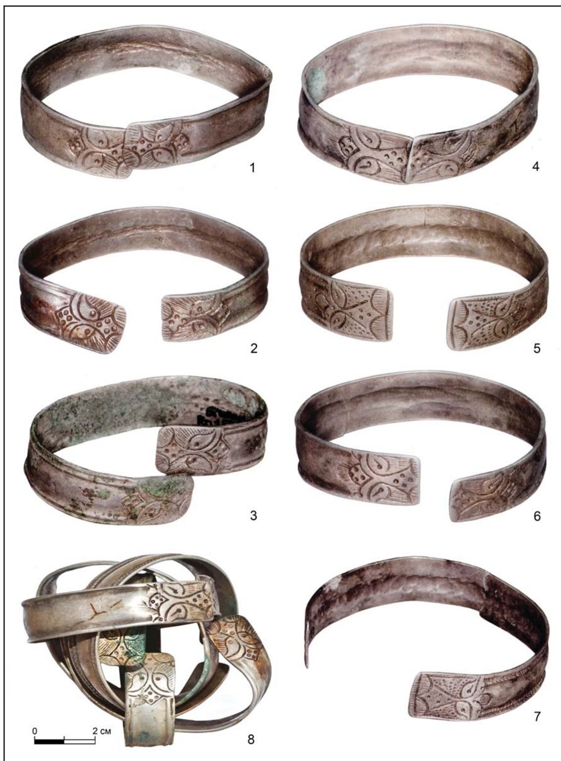
Рис. 6. Серебряные браслеты из клада ювелирных украшений. Болгарское городище. Раскоп CLXXIV. БГИАМЗ, 1 — инв. №1533; 2 — инв. №1530; 3 — инв. №1532; 4 — инв. №1535; 5 — инв. №1531; 6 — инв. №1534; 7 — инв. №1529; 8 — состояние браслетов на момент обнаружения (по Руденко, Елкина 2017: рис. 6).