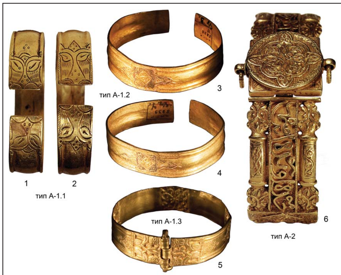
Рис. 3. Типология золотых браслетов из Булгарской области Золотой Орды. Группа I. Отдел I. Типы A-1, A-2. 1, 2 — Болгарский клад 1877 г. ГЭ, инв. №30-704, 705 (по Сокровища 2000: 79, 231, 232, кат. №71, 72); 3—5 — Булгарское городище. НМ РТ, 3 — инв. №5838; 4 — инв. №5839; 5 — инв. №5837 (по Руденко 2018: 117—118, рис. 6: 7, 8; 7: 7); 6 — клад 1924 г. из Чистополя, т.н., «Джукетаусский». ГЭ, инв. №30-717 (по Сокровища 2000: 79, 242, кат. №111).

Fig. 3. Typology of golden bracelets from Bulgar region of the Golden Horde. Group I. Unit I. Types A-1, A-2. 1, 2 — Bolgar hoard of 1877. SH, inv. no.30-704, 705 (after Сокровища 2000: 79, 231, 232, cat. no.71, 72); 3—5 — Bulgar hillfort. NMRT, 3 — inv. no.5838; 4 — inv. no.5839; 5 — inv. no.5837 (after Руденко 2018: 117—118, fig. 6: 7, 8; 7: 7); 6 — hoard of 1924 from Chistopol, aka "Dzhuketaussky". SH, inv. no.30-717 (after Сокровища 2000: 79, 242, cat. no.111)..