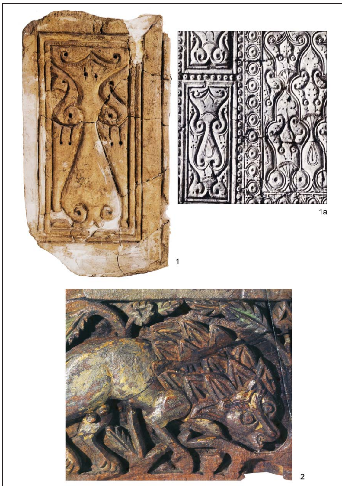
Рис. 1. Орнаментальные мотивы на стукковых и деревянных панелях Омейядского и Аббасидского периодов. 1, 1a — стукковая панель из Самарры, IX в. (по Rice 1965: 34, ill. 26); 2 — деревянная панель из Фусата, VII в. (по The Treasures... 2006: 26, cat. no. 16).