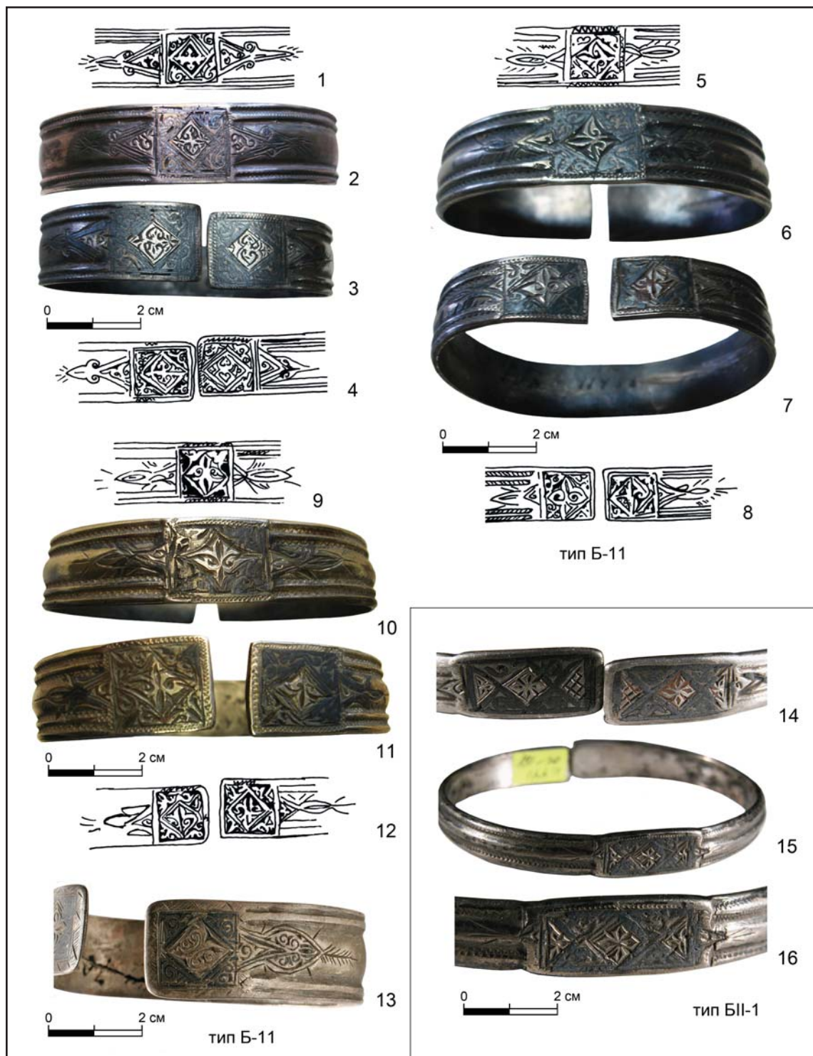
Рис. 5. Серебряные браслеты из Булгарской области Золотой Орды с черневым декором. Карашамский клад. Конец XIV — начало XV в. 1—13 — тип Б-11; 14—16 — тип БII-1. НМ РТ, 1—4 — инв. №11439 (1, 4 — прорисовка орнамента); 5—8 — инв. №11438 (5, 8 — прорисовка орнамента); 9—12 — инв. №11437 (9, 12 — прорисовка орнамента); 13 — инв. №11440; 14—16 — инв. №11441 (детали: середина спинки (15) и окончания браслета (14)) (по Руденко 2015: 415—419, кат. №180, 182, 183, 184, 191).

Fig. 5. Silver bracelets from Bulgar region of the Golden Horde, with niello. Hoard from Karasham. Late 14th – early 15th century. 1—13 — type Б-11; 14—16 — type БII-1. NMRT, 1—4 — inv. no. 11439 (1, 4 — drawing of the ornament); 5—8 — inv. no. 11438 (5, 8 — drawing of the ornament); 9—12 — inv. no. 11437 (9, 12 — drawing of the ornament); 13 — inv. no. 11440; 14—16 — inv. no. 11441 (details: central part of the body (15) and bracelet ends (14)) (after Руденко 2015: 415—419, cat. no. 180, 182, 183, 184, 191).