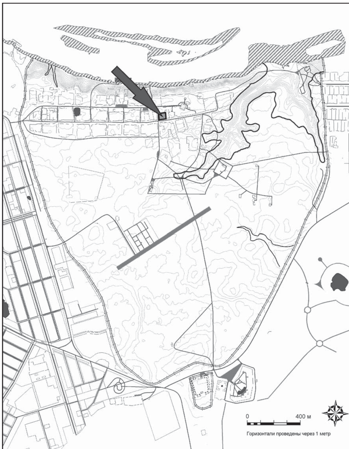
Рис. 1. Место расположения рассматриваемых усадеб XIV в. на плане Болгарского городища.