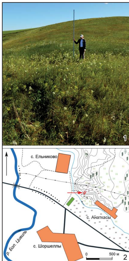
Рис. 1. Анаткасинский могильник: 1 — общий вид с юга; 2 — ситуационный план (могильник указан стрелкой).

Процесс дальнейшего освоения и формирования территории русско-ордынского пограничья в Марийско-Чувашском Поволжье, по всей вероятности, продолжается и на рубеже XIII—XIV вв. Можно предположить, что главным фактором в освоении пограничья является активизация политики Золотой Орды, направленной на формирование «буферных зон» на русско-ордынском пограничье. Опираясь на данные археологии, можно утверждать, что в XIV—XV вв. формируется новый, третий, пограничный регион и своеобразная этнокультурная и этноконтактная зона — Чувашское Присурье. В исторической литературе р. Сура представлена как граница сначала золотоордынских, а затем казанскоханских владений. Достаточно яркими поселениями левобережья р. Суры эпохи Золотой Орды, характеризующимися смешанным этническим составом, чему, вероятно, способствовало их расположение в русско-золотоордынском пограничье во второй половине XIV — начале XV вв., являются крепость