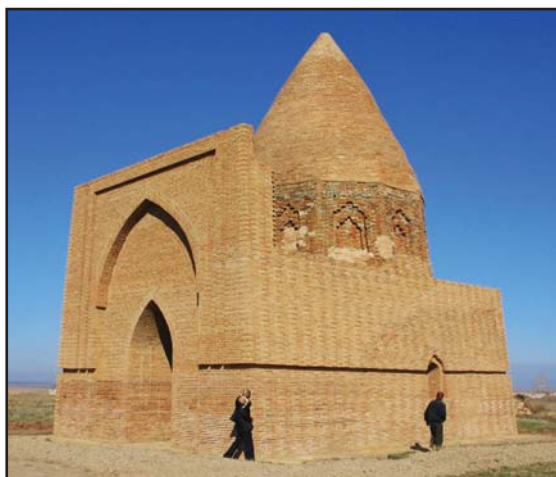
Рис. 6. Мавзолей Абат Байтак. Современное состояние после реконструкции.

Fig. 6. Mausoleum Abat Baytak. A current state after reconstruction.