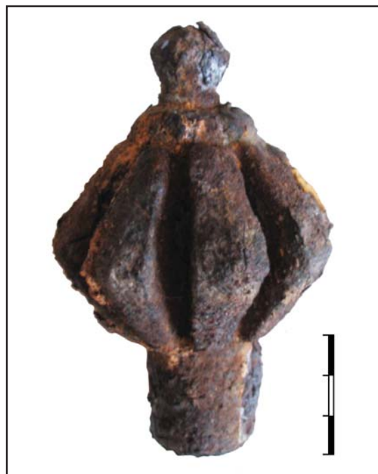
Рис. 7. Мавзолей Абат Байтак. Железное навершие посоха.

Таким образом, можно отметить, что крупные события в политической жизни кочевников степной полосы Евразии отражались в доминировании тех или иных племенных групп, приводили к изменениям в этнокультурных процессах и в конечном итоге получали свое выражение в археологическом материале. Территория Западного Казахстана в XIII—XIV вв. была включена во все протекавшие в евразийской степи процессы и явления, подкорректированные местными специфическими особенностями. Общие тенденции изменений в погребальной обрядности поддаются реконструкции и позволяют проследить смену ритуалов по хронологическим периодам. Перспективы дальнейшего углубленного исследования памятников Западно-