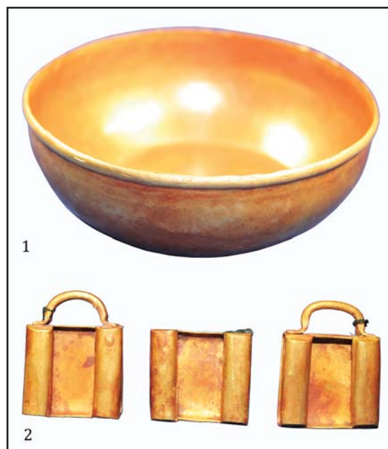
Рис. 3. Могильник Уркач I. 1 — золотая чаша; 2 — золотые накладки пояса. Масштабы разные.

Fig. 3. Urkach I cemetery. 1 — gold bowl; 2 — gold overlays of a belt. Scales are different.