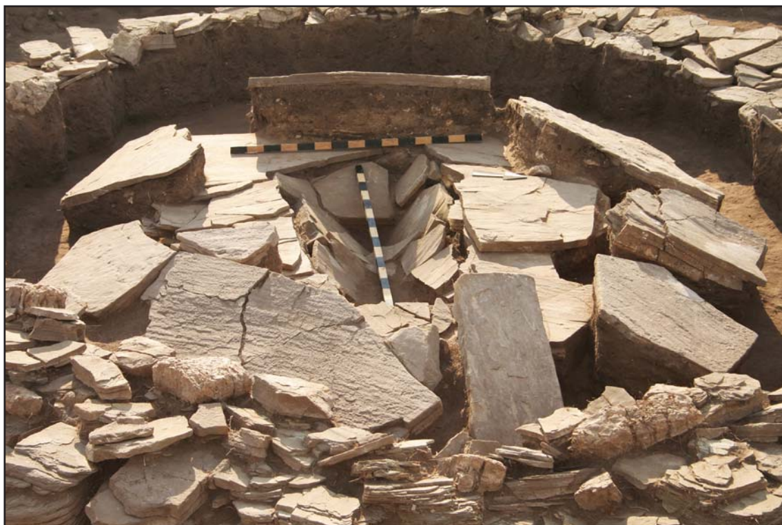
Рис. 5. Могильник Сарытау II. Общий вид каменной конструкции погребения.