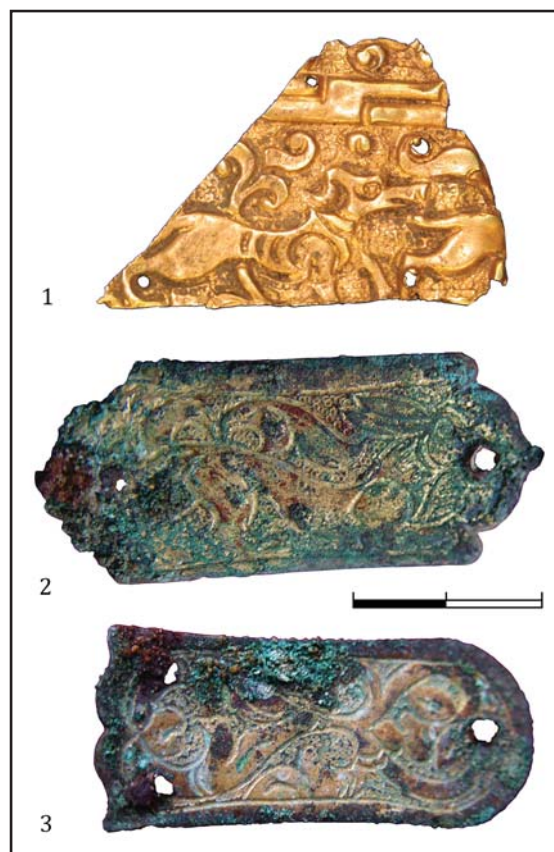
Рис. 4. Могильник Булак. 1 — золотая нашивная бляшка головного убора; 2, 3 — бронзовые с золочением бляхи конской сбруи. Масштабы разные.

В золотоордынский период в различных регионах Казахстана появляются погребения, эволюционно восходящие к датируемым несколько более ранним временем памятникам южной части Западной Сибири — такие как Кула-Айгыр, Сарытау II, Салтак I, причем обнаруживаются они единично, далеко друг от друга, и характеризуются совершенно нестандартными и не характерными для местного населения чертами (Федоров-Давыдов 1984: 98—107; Кызласов 1980: 80—93; Боталов 1992: 230—239; Бисембаев, Гуцалов 1998: 152—155). Женское погребение из могильника Салтак I в Западном Казахстане сопровождала каменная квадратная конструкция, выложенная на погребенной почве, и жертвоприношение ребенка над могильной ямой. Комплект инвентаря стандартный для этого периода — бронзо-