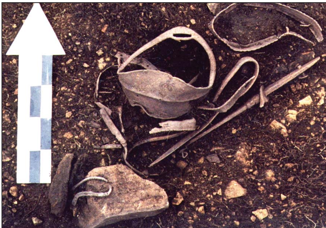
Рис. 2. Курган №5, могильник Коя 2. Комплекс металлических деталей предметов вооружения и конского снаряжения.