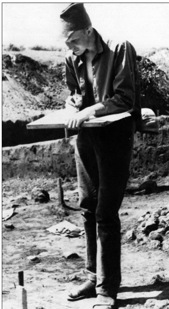
Фото 8. Экспедиция И.И. Ляпушкина в Гнездово. 1968 год.

Photo 8. I.I. Lyapushkin's expedition to Gnezdovo. 1968.