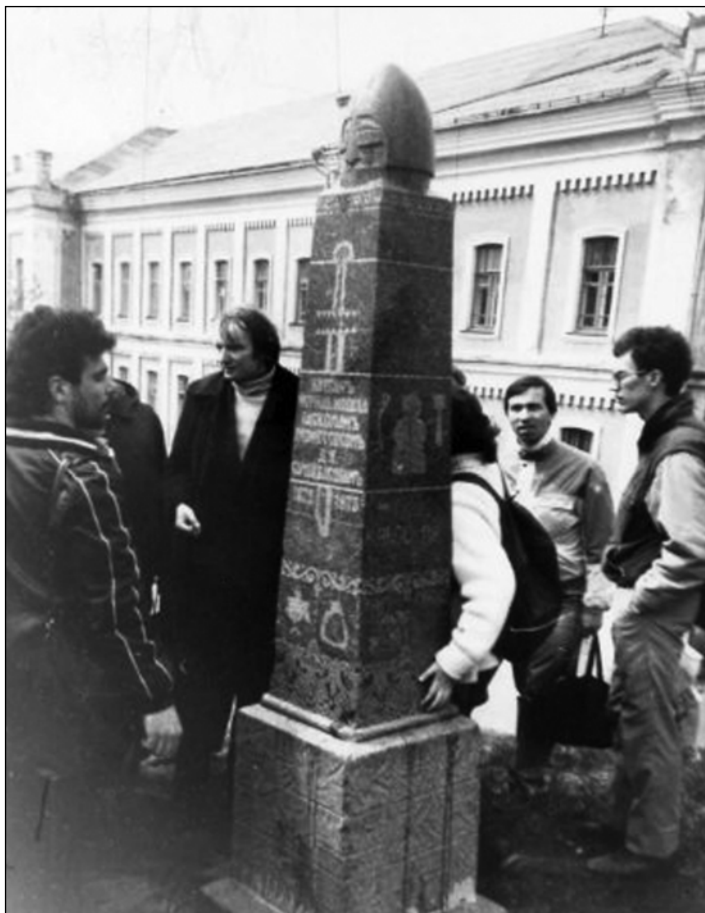
Photo 20. With the third-year students of the Leningrad State University, museum internship in Kiev. 1988.

Фото 20. Со студентами третьего курса ЛГУ на музейной практике в Киеве. 1988 год.