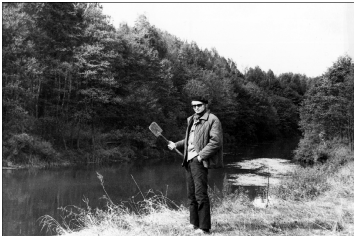
Фото 22. После раскопок в Старой Ладоге. Городище на р. Сясь. 1986 год.

Photo 22. After the excavations at Staraya Ladoga. Hillfort on the Syas' River. 1986.