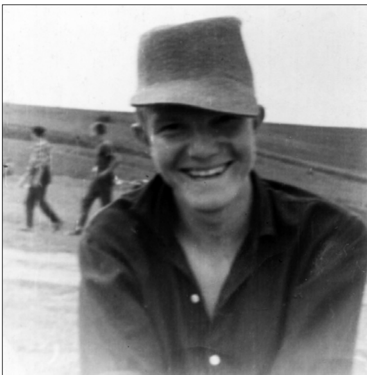
Фото 1. Шепетовка, экспедиция М.К. Каргера. 1963 год.

Photo 1. Shepetovka, M.K. Karger's expedition. 1963.