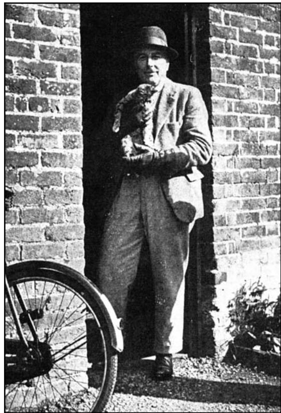
Рис. 1. О.Г.С. Кроуфорд (1930-е гг.) (Crawford 1955; оборот титульной страницы).

Создателем Antiquity является Осберт Ги Стэнхоуп Кроуфорд (Osbert Guy Stanhope Crawford) (1886—1957) (рис. 1), известный британский археолог и географ, выпускник Оксфордского университета (1910 г.) (см. также: Клейн 2011: 529—533). Идея организовать издание, в котором новейшие достижения в археологии и близких к ней науках — древней истории, антропологии, этнографии (применительно к древнему прошлому), исторической географии — были бы изложены доступным для широкой общественности языком, но с сохранением качества и научной достоверностью, пришла к Кроуфорду в конце 1925 г. (см. Crawford 1936; 1955: 187—200). Взяв взаймы у коллеги-археолога и наследника старейшей британской торговой марки мармелада Keiller & Sons Александра Кейлера 100 фунтов стерлингов, Кроуфорд потратил их осенью 1926 г. — зимой 1927 г. на рассылку 20 000 приглашений подписаться на новый журнал. Положительно ответило более 1200 человек; этого было достаточно для организации независимого печатного издания, первый выпуск которого (рис. 2) появился 15 марта 1927 г. Стоимость годовой подписки на четыре номера была установлена в 20 шиллингов (или 1 фунт), включая расходы на пересылку по всему миру; отдельный номер можно было купить за 5 шиллингов и 6 пенсов (в шиллинге было 12 пенсов; в фунте стерлингов было 20 шиллингов).