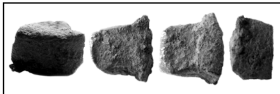
Рис 4. Нововодолажский штемпель №2. Общий вид.