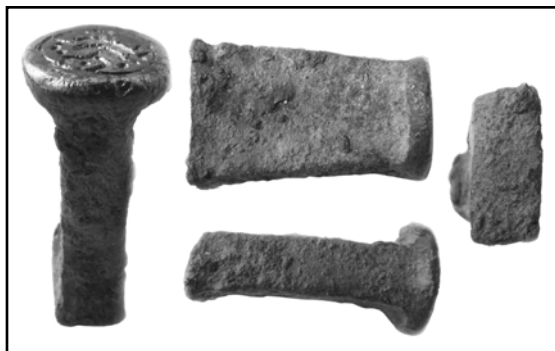
Рис. 2. Штемпель №1 для подражательной монетной чеканки, найденный близ поселка Новая Водолага. Общий вид.