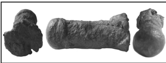
Рис 6. Металлический инструмент №3 из нововодолажского комплекса. Общий вид.