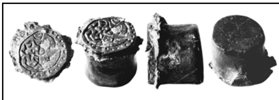
Рис. 1. Штемпель для чеканки подражаний джучидским монетам из Змиевского района Харьковской области.