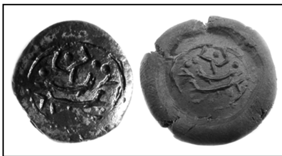
Рис. 3. Рабочая поверхность нововодолажского штемпеля №1 и оттиск с него.

Монетный штемпель, введению в научный оборот которого посвящена данная статья,