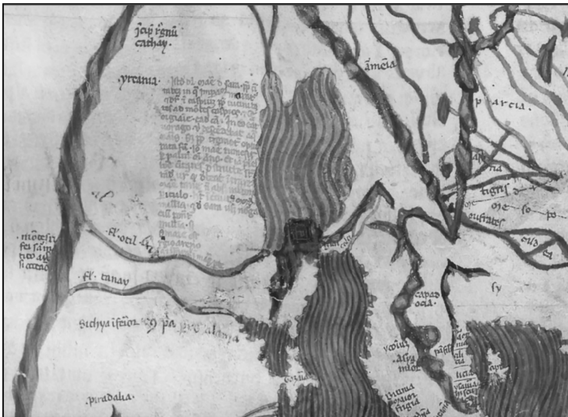
Рис. 1. Фрагмент карты из трактата Фра Паолино «Большая хронология» 1320 г. (Paris, Bibliothèque Nationale, MS. Lat. 4939, F.9r).