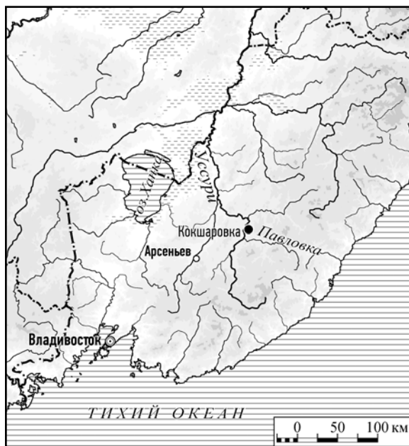
Рис. 1. Местоположение городища Кокшаровка.