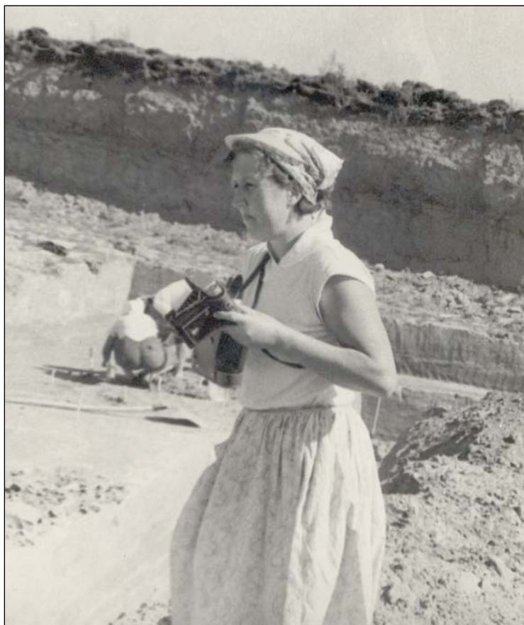
Фото 7. Кокорево. 1963 г.