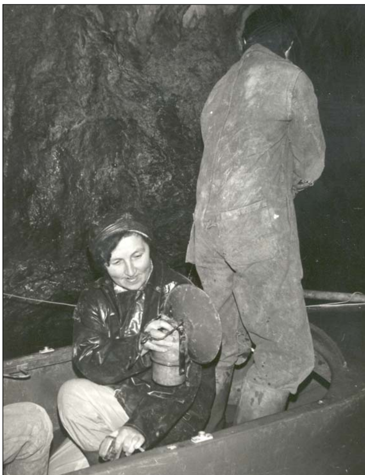
Фото 12. Франция. в пещере Тюк д'Одубер. 29 декабря 1974 г.

Foto 11. Kostenki, August of 1972. With N.D. Praslov.