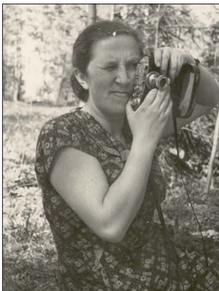
Фото 6. Ораниенбаум. Весна 1959 г.