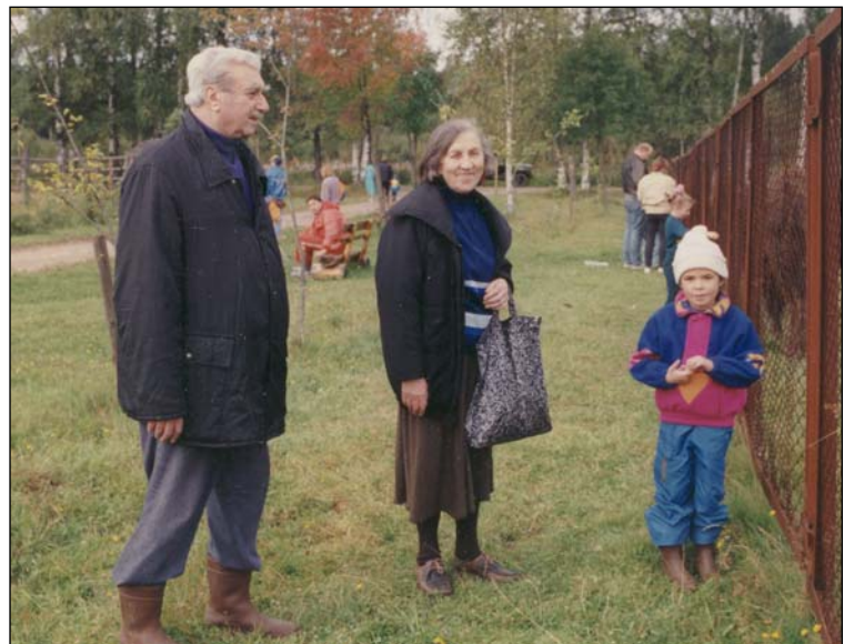
Фото 15. Токсово. С мужем и внучкой. Октябрь 1993 г.

Foto 14. USA, 22 June 1991. With G.F. Korobkova (on the left) and O.A. Soffer (on the right).