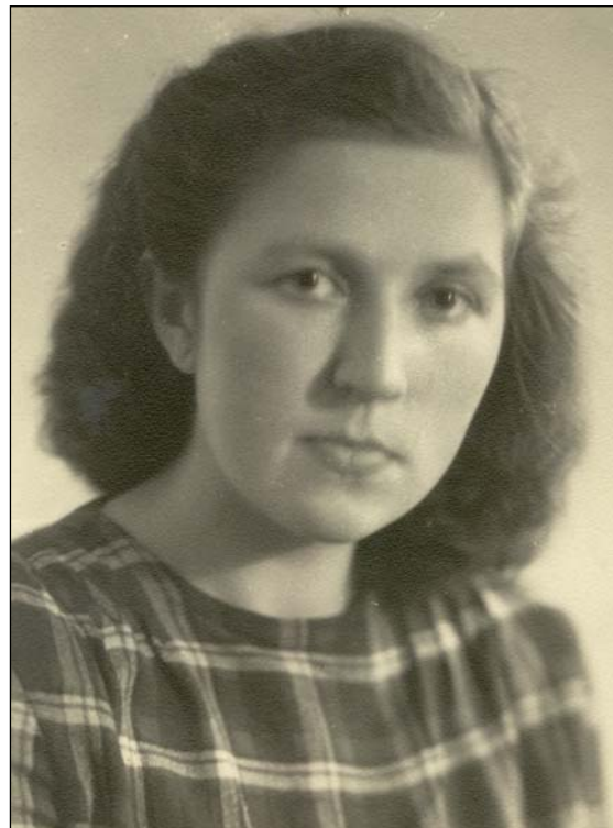
Фото 3. Студенческие годы.