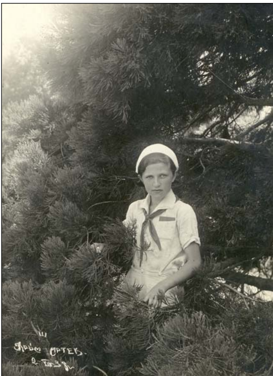
Фото 2. Артек. Март 1938 г.