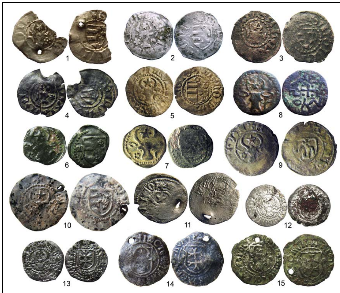
Рис. 1. Молдавские средневековые монеты: 1 — Петр I; 2 — Стефан I; 3—7 — Александр I; 8 — тип «Аспрокастрон»; 9 — Ильяш I; 10 — Стефан II; 11 — Петр II (?); 12—13 — Стефан III; 14—15 — Стефан IV (1,25:1).