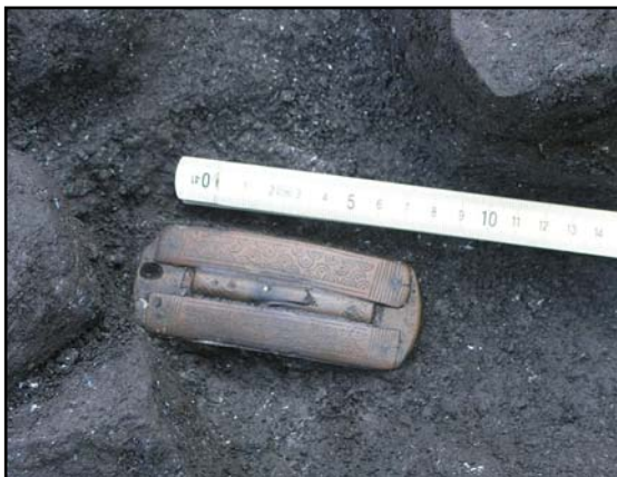
Рис. 1. Земляное городище, 2013. Яма в кв. П, Р-ХІХ, ХХ. Положение гребня in situ . Вид сверху.