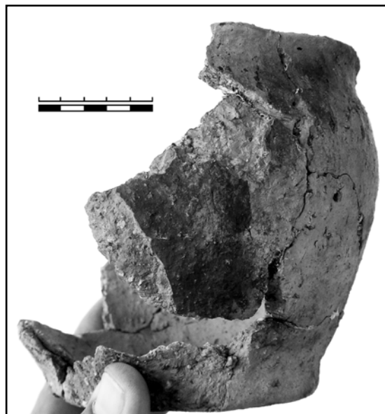
Рис. 3. Земляное городище, 2013. Реставрированный сосуд из ямы в кв. П, Р-ХII, ХIII.

Черный предматериковый слой, толщиной 12—20 см, содержащий в большом количестве деструктурированный уголь и некоторое количество древесного тлена, встречен по всей поверхности раскопа №5, а также на примыкавших к нему раскопах №3 и №4. Этот же слой ранее был отмечен в западной части Земляного городища на раскопе Е. А. Рябинина 1973—1975 гг. и описан на раскопе В. П. Петренко 1972—1977 гг., находившемся на левом, противоположном от Земляного городища, берегу реки Ладожки, в зоне Варяжской улицы. В. П. Петренко так описывал стратиграфию нижних слоев на своем раскопе: «Нижние отложения имели хорошо выраженную слоистость. В них неплохо сохранились дерево и другие органические материалы. Подстилающий культурный слой материк — плотная вязкая глина слабо зеленого цвета — вивианит... Культурный слой отделен от материка темной гумусной с коричневым оттенком прослойкой — погребенной почвой» (Петренко 1985: 83). Е. А. Рябинин, со своей стороны, называл черный слой предматериком: «Ниже слоя коричневатого-бурого гумуса, — писал он, — начинается предматерик — чёрный гумус толщиной 8—12 см с включениями голубоватой материковой глины — вивианита. Он почти лишен вещевых находок. Изредка в пред-