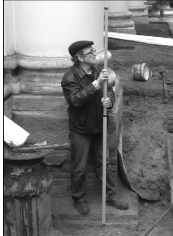
Фото 8. На раскопках Зимнего дворца в Санкт-Петербурге. 2012 г. (фото С.В. Белецкого).

Photo 7. Excavations on the shore of Admiralteysky Canal (photo by E. R. Mikhaylova).