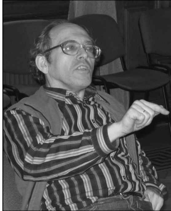
Фото 11. Выступление на заседании в Эрмитаже в Санкт-Петербурге. 2007 г. (фото С.В. Белецкого).

Photo 10. At the Conference in G.F. Korzukhina's Memory, Institute for the History of Material Culture of the Russian Academy of Sciences. April 10, 2006 (photo by K.A. Mikhaylov).