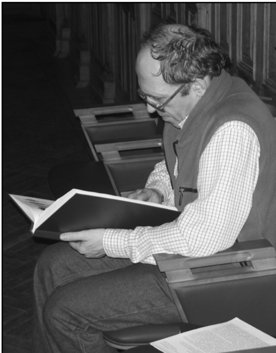
Фото 12. На заседании в ИИМК РАН в Санкт-Петербурге. 2007 г. (фото С.В. Белецкого).

Photo 11. Presentation at a session in Hermitage Museum, Saint-Petersburg, 2007 (photo by S.V. Beletsky).