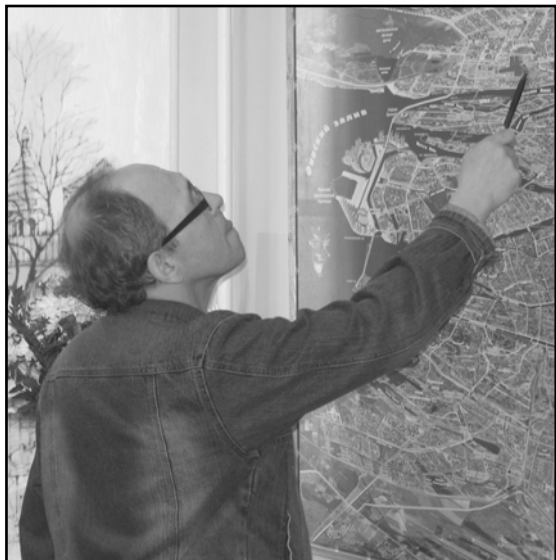
Фото 13. Выступление перед студентами СПбГУКИ. 2011 г..

Photo 12. At a session in Institute for the History of Material Culture of the Russian Academy of Sciences, Saint-Petersburg, 2007.