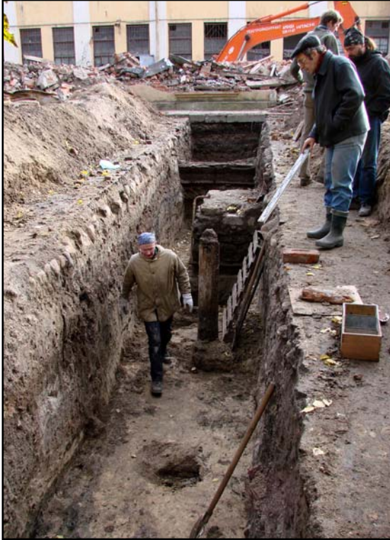
Фото 7. Раскопки на берегу Адмиралтейского канала.

Photo 7. Excavations on the shore of Admiralteysky Canal.