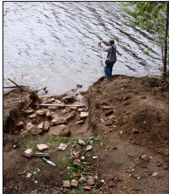
Фото 4. Ю.М. Лесман фотографирует раскоп на Мойке.

Photo 3. Yu. M. Lesman photographs the excavation from the timber yards window.