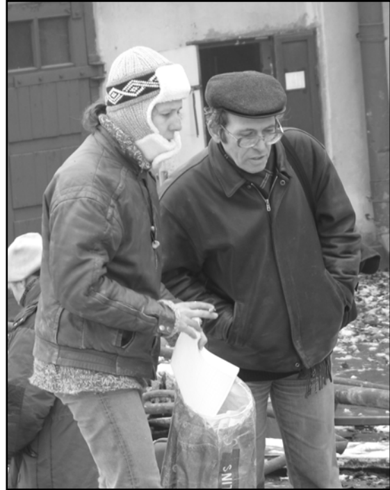
Фото 2. На раскопках Новой Голландии в Санкт-Петербурге. 2006 г..

Photo 1. Yu. M. Lesman. Archaeologist' day in New Holland, 2007.