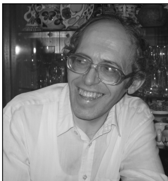
Фото 19. Дома. 2005 г..

Photo 19. At Home, 2005.