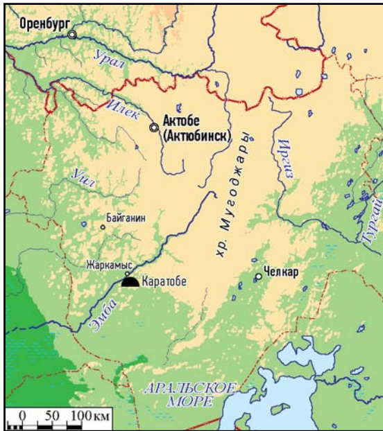
Рис. 1. Местоположение могильника Каратобе.