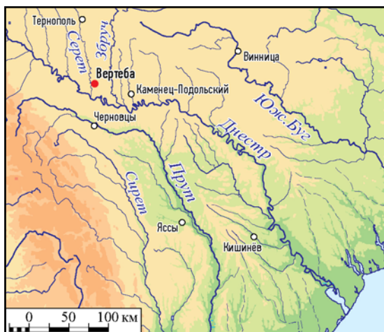
Рис. 1. Расположение пещеры Вертеба на карте региона.

Еще до появления археогенетических данных исследователи неоднократно указывали на доледниковое происхождение гаплогруппы Н на территории Европы (Achilli et al. 2004). Не вызывает сомнения и то, что некоторые носители этой группы пережили ледниковый период в так называемых ледниковых убежищах, обладавших более мягким климатом, позволявшим перенести суровые условия глобального обледенения. По общепринятым представлениям, такими зонами являлись северо-западная часть Пиренейского полуострова и Крымский полуостров, а также, по нашему убеждению, и Карпатский регион (Nikitin et al. 2009). Последнее объясняет одну из самых высоких в Европе частоту гаплогруппы Н у современных жителей гор-