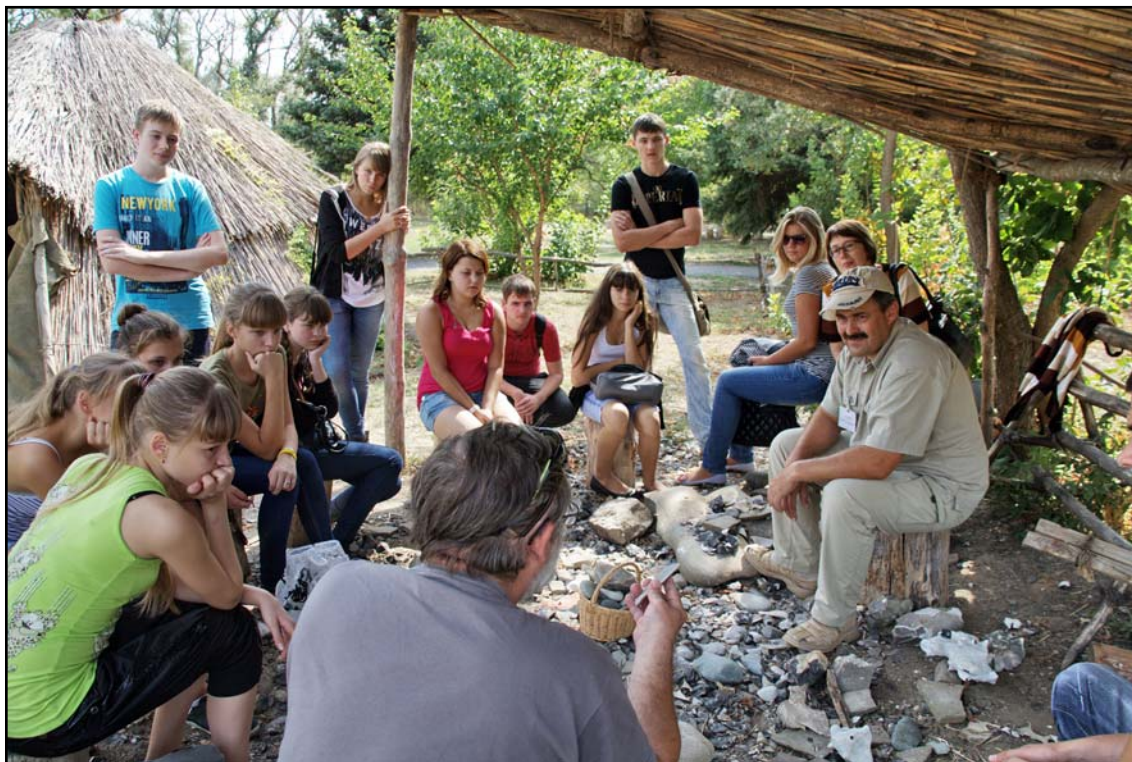
Рис. 7. Занятия со школьниками старших классов на площадке для расщепления камня в Этно-Археологическом комплексе «Затерянный мир».