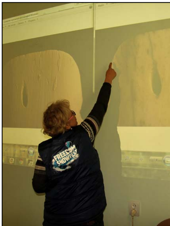
Рис. 6. Сравнение микро-макроследов на бивневом орудии после напыления оксида магния и без него во время занятий Международной экспериментально-трасологической школы-семинара в 2013 году.

Fig. 6. Comparison of macro- and microtraces on an ivory tool as seen with and without dusting with magnesium oxide. International School-Seminar, 2013.