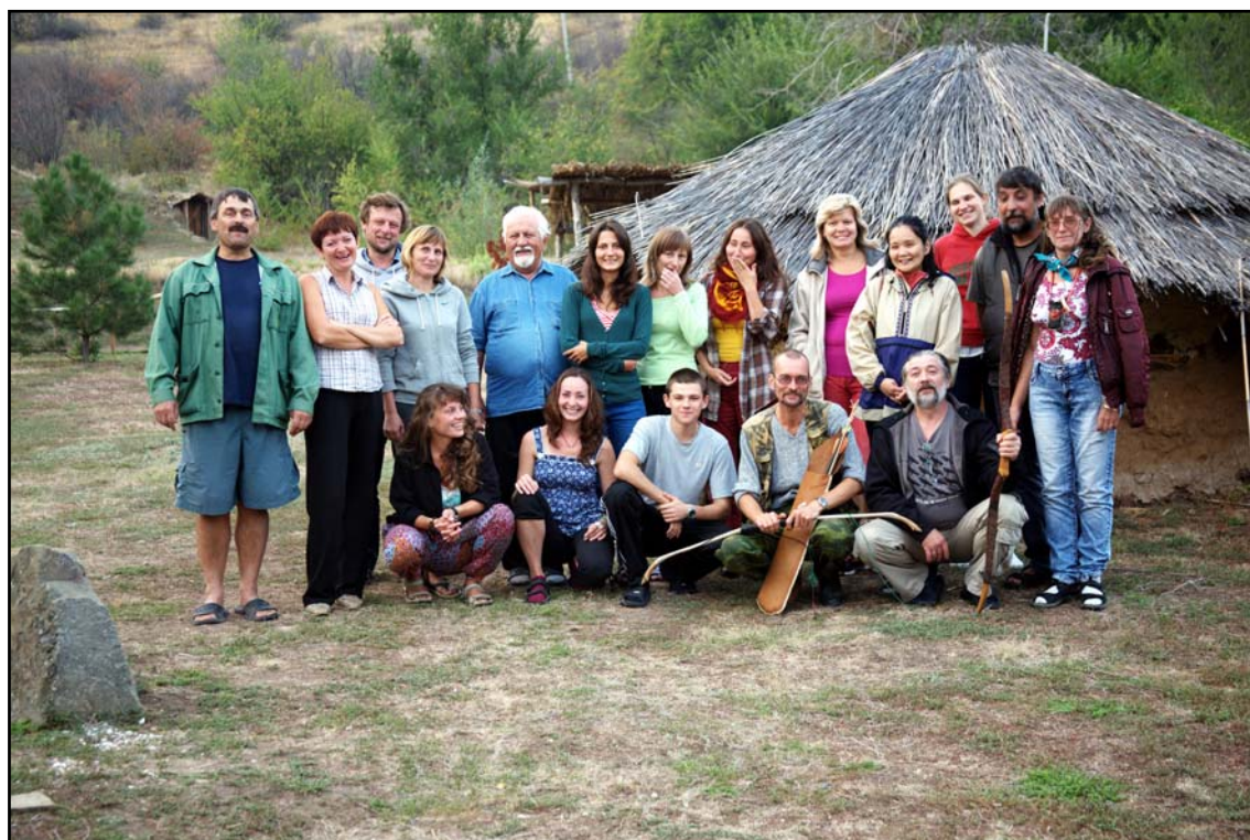
Рис. 1. Участники Международной школы-семинара 2012 года на фоне реконструкции неолитического жилища (Этно-Археологический комплекс «Затерянный мир»).