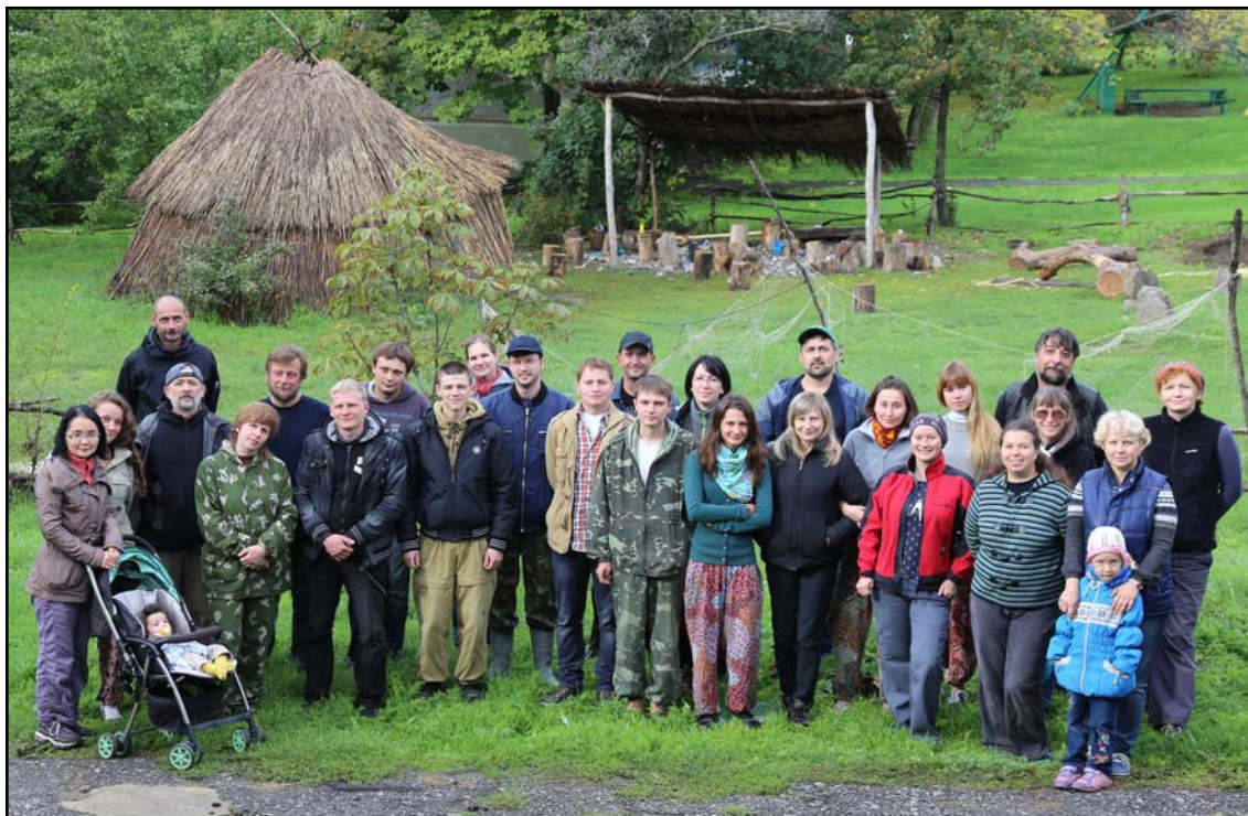
Рис. 2. Участники Международной школы-семинара 2013 года на фоне площадки для проведения экспериментов (Этно-Археологический комплекс «Затерянный мир»).