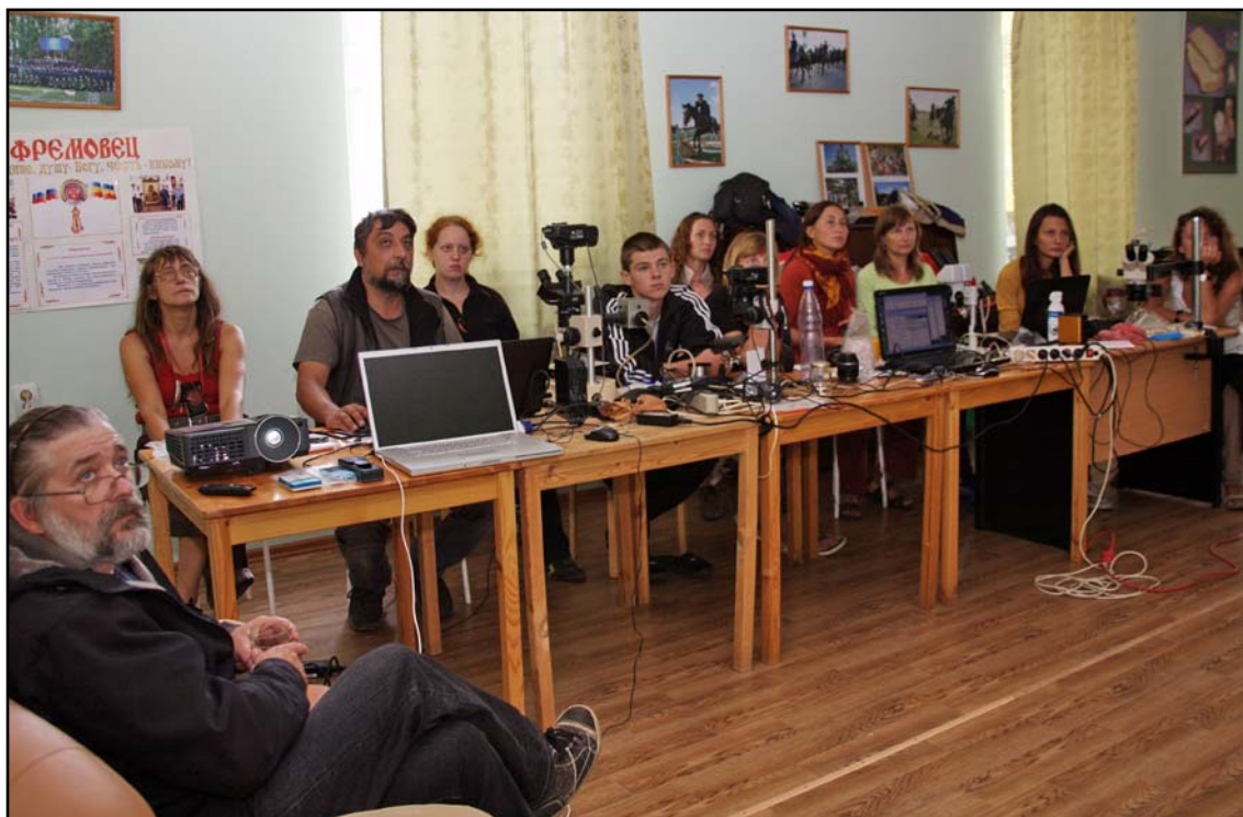
Рис. 5. Коллективный анализ микро-макроследов во время занятий Международной школы-семинара в 2012 году.