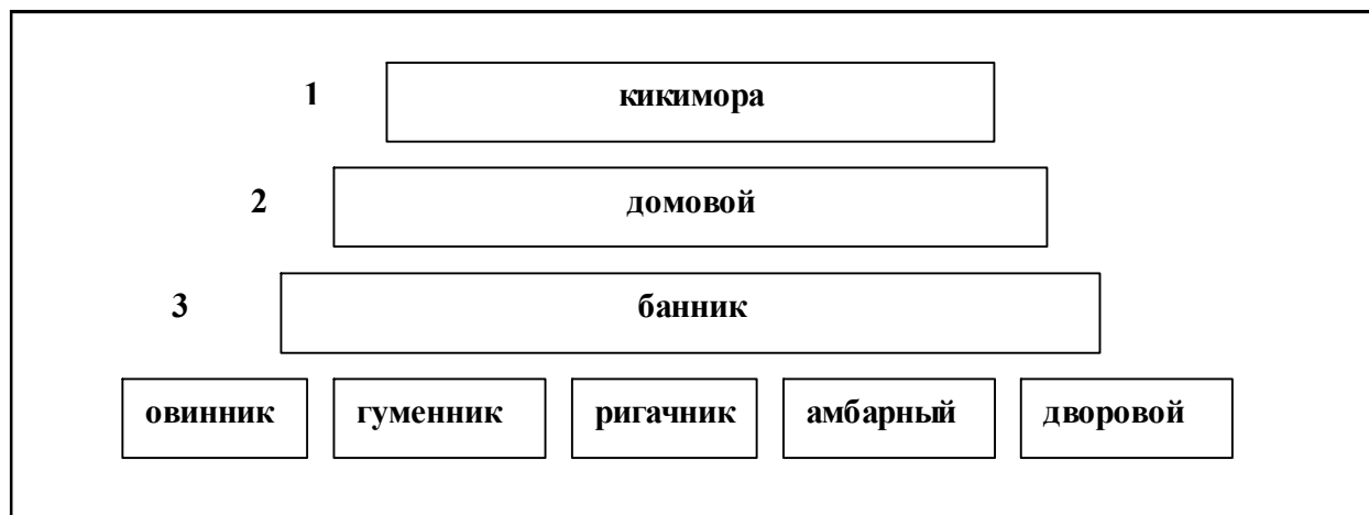
Рис. 1. Иерархическая лестница образов демонологии (вариант реконструкции).

могущественнее домового, к тому же по «правилам» низшего пантеона» кто старше, тот сильнее. В связи с этим мы гипотетически располагаем данный образ на первой ступени нашей иерархической лестницы (рис. 1).