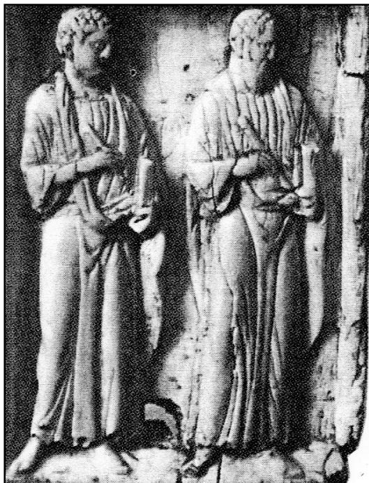
Рис. 3. Часть триптиха из слоновой кости со свв. Космой и Дамианом в нижней части, X в. (по: Bank 1985).

Культ двух братьев-врачей, похоже, был широко распространён, его свидетельства весь-