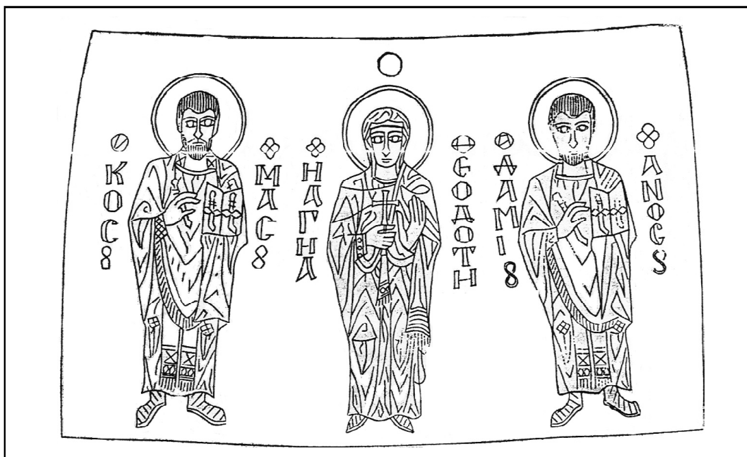
Рис. 4. Бронзовая доска из Сицилии с Феодотой и свв. Космой и Дамианом, XI в. (по: Agnello 1962).

Божия, помоги нам» (Рыбаков 1984: 454-455). Кресты, изготовленные в той же форме, с ошибочной надписью на реверсе и с высотой 8,5 см или около того, обнаружены во многих местах на территории Руси (Алексеев 1974: 212-213, рис.4/5-6; Рыбаков 1984: 39, №41). Отдельные случайные находки можно отметить в коллекциях некоторых музеев Болгарии (Дончева-Петкова 1983: 122-123, чертёж V/2), Венгрии (Lovag 1971: 160, fig.6/1a-1b) и Германии (Byzantinische 1977: 61, №113b, pl.33).