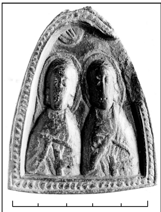
Рис. 1. Керамический медальон из Исакичи (XIII в.). вблизи гранитных массивов со старыми палеозойскими породами, что характерно для Добруджи.

Что касается техники, использованной для изготовления предмета, можно указать на параллельные полосы под уровнем лощения и на чёткую гладкую зону. Это свидетельствует о том, что мягкую пасту глинистого материала обработали штампом, а затем она была обезвожена путём слабого обжига. Моделирование фигур производилось на стадии мягкой или полумягкой пасты, поскольку на материале обнаружены не следы резьбы, а скорее шлифовки. Эта гипотеза подтверждается наблюдением, что поверхности предмета могли получиться только путём оттиска и шлифования на стадии, когда материал был ещё мягким. Мысль, что исходным материалом была смесь высококачественной глины и железняка, подтверждается и второстепенными элементами, имеющимися в составе материала.