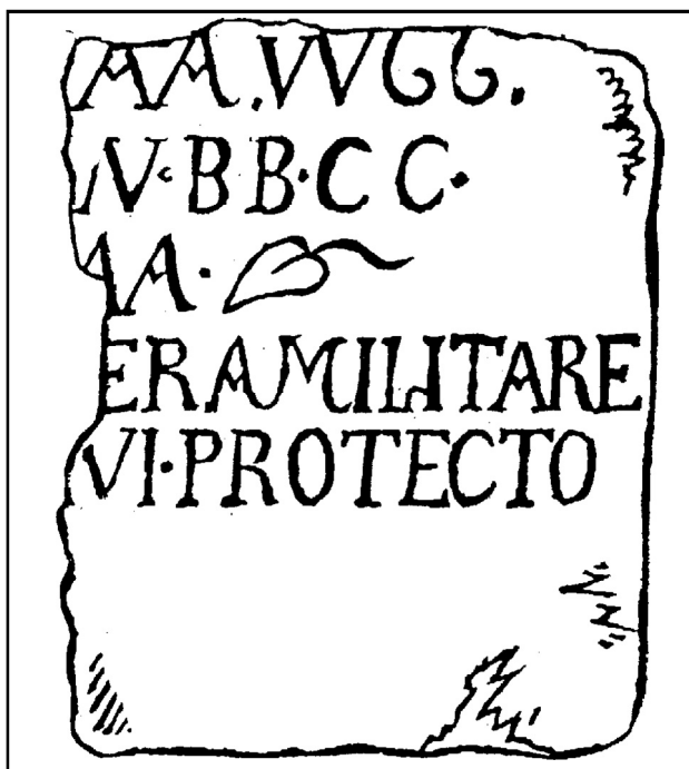
Рис. 2. Фрагментированная надпись с упоминанием протектора по П. С. Палласу и Э. И. Соломоник.

загнутой вверх нижней гостой, аналогичная написанию L в посвящении Аврелия Канди... . Такое написание буквы L зафиксировано в ряде надписей первой половины III в. из Монтаны (Велков, Александров 1994: 17, № 32; с. 21, № 42; с. 28–29, № 57; с. 47, № 114), в надгробии конца III – начала IV в. из Нове (Kolendo, Bozilova 1997: 111–112, № 75), где располагался основной лагерь I Италийского легиона, а также в надписях из Одессоса и территории Паннонии, которые датируются третьей четвертью IV в. (Soropii 1985: 111–112; Manzella 1999: 79–96).