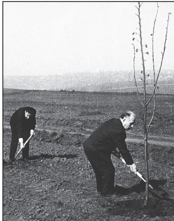
Рис. 8. «Вырастить сына, построить дом, посадить дерево...». 1975 г.