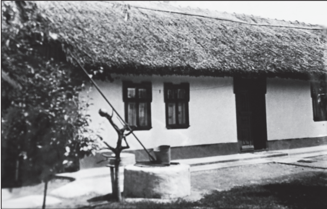
Рис. 1. В этом доме в 1912 г. родился Я.С. Гросул.