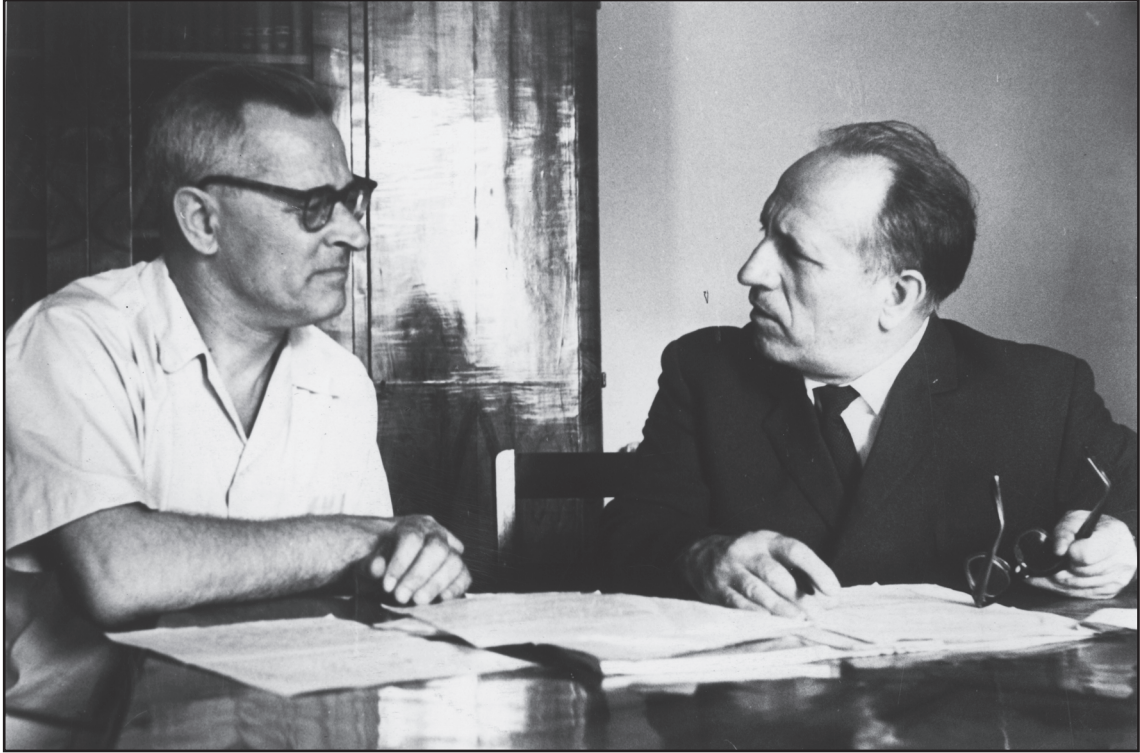
Рис. 4. С академиком А.В. Абловым. Конец 60-х гг.