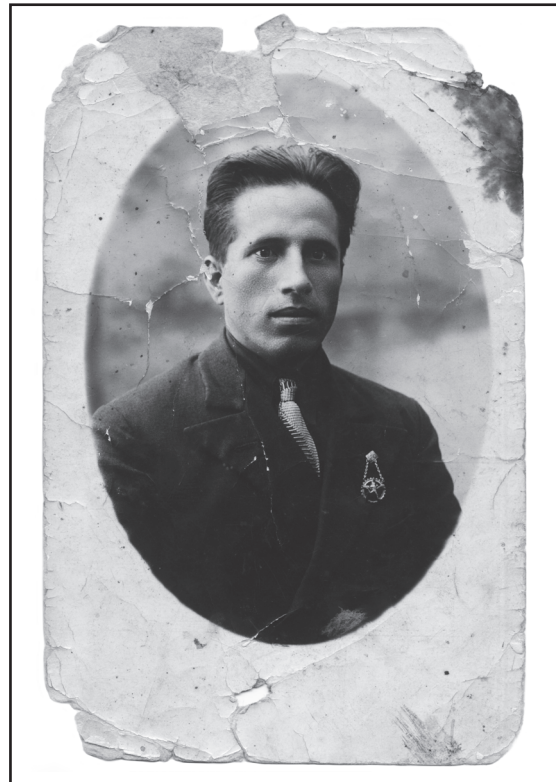
Рис. 3. Выпускник исторического факультета. 1937 г.