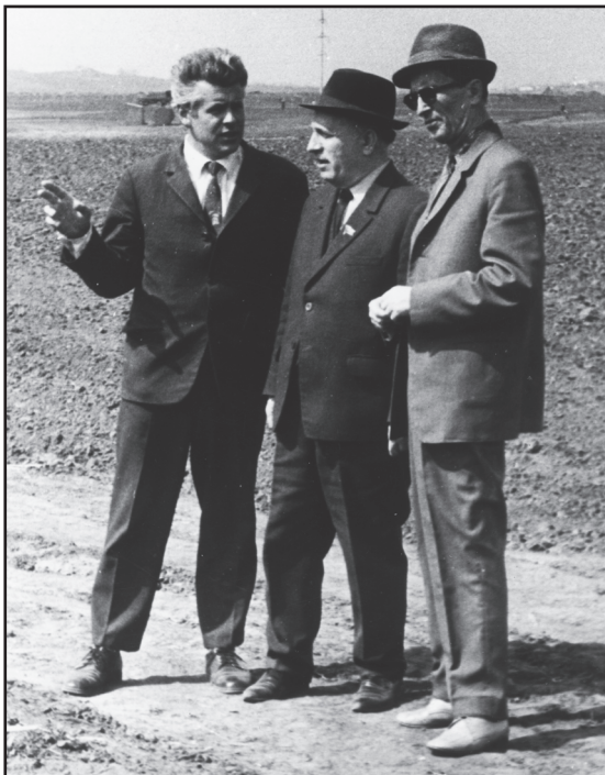
Рис. 7. Президент АН МССР со своими помощниками А. Чеботару и И.К. Вартичаном на закладке Ботанического сада. 1975 г.