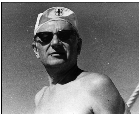
Рис. 8. На острове Березань, 1975 г.