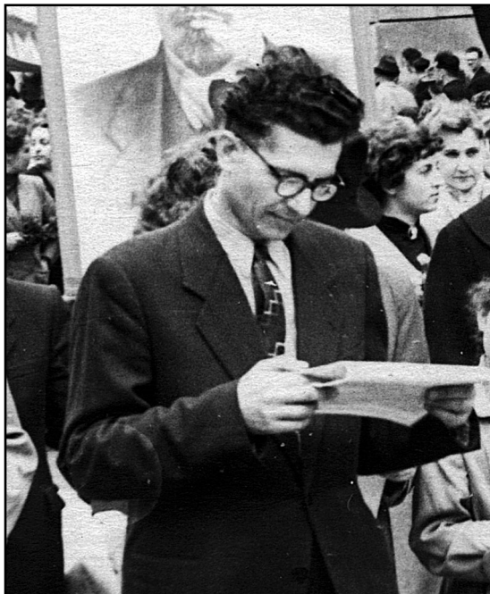
Рис. 7. На первомайской демонстрации, конец 1960-х гг.

Разлуки, встречи, вновь разлуки, — И жизнь проходит как в дыму. И рвёшь, и простираешь руки