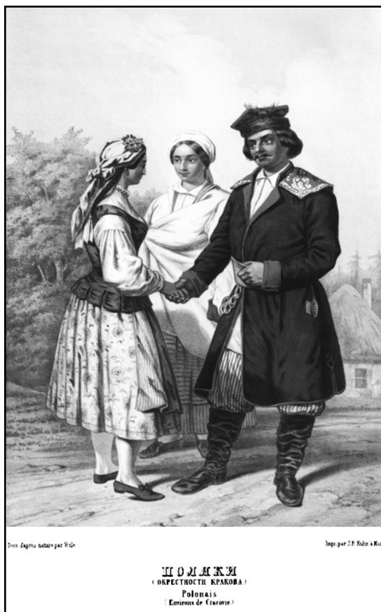
Рис. 5. Поляки. Иллюстрация из книги Г.-Т. Паули.

«Description» представляет собой солидный том большого формата и состоит из предисловия, описательных текстов, иллюстраций, их перечня, этнографической карты и краниологической таблицы. Издание вышло в Санкт-Петербурге на французском языке, подписи под иллюстрациями (названия народов) даны также и на русском языке.