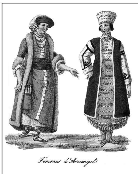
Рис. 4. Архангельские женщины. Иллюстрация из книги Ж. Б. Бретона.

Он занимался литературными трудами, переводами, выпуском книг с описаниями разных стран. Среди них были книги о костюмах и искусстве России.