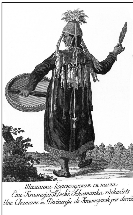
Рис. 2. Шаманка красноярская с тыла. Иллюстрация из книги Георги И.-Г.

Особое значение в сочинении Георги имеют раскрашенные иллюстрации, выполненные граверами Х. Ротом и Д. Шлеппером «частью с находящимися рисунков и фигур при