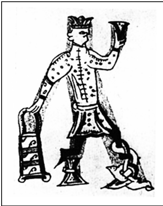
Рис. 2. Скоморох в свите с застёжкой до пояса. Инициал «Х». Псалтирь XIV в.

Верхние рубашки и свиты обязательно подпоясывались. Значение пояса в мировоззрении средневекового человека было очень велико. Недаром бытовало столько слов, обозначающих этот предмет одежды: пояс, опояска, гашник, кушак... Пояс в средневековой Руси выполнял не только утилитарную функцию (стягивал одежду), но также обрядовую и социальную. Если пояс был тканым, то он завязывался на два узла на животе. Узел («науз») обозначал союз, завязь, живот, жизнь. На покойниках пояс завязывали одним узлом, чтобы облегчить переход в иной мир. Надевание на себя опояска с наузами в ис-