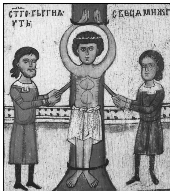
Рис. 1. Изображение мужских рубах на клейме иконы «Георгий с житием», Новгород, XIV в.

В XV в., судя по изобразительным источникам, покроем новгородской свиты меняется — это уже распашная одежда без воротника — «голошейка», приталенная, с подкладкой контрастного цвета. На московской иконе конца XV в. «Митрополит Петр с житием» на князе и боярах изображены свиты с отложными воротниками. Впрочем, вполне возможно, что на данном источнике уже изображен кафтан. Термин «кафтан» по-