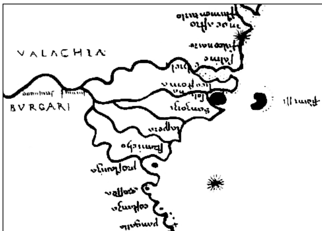
Рис. 3. Фрагмент карты Черного моря «MARE PONTICUM SIVE PONTUS EVXINVS». Предположительно, Генуя, XVI в.

Пункт liscostomo обычно соотносят с современным пунктом Вилково в Украине, расположенном в том месте, где Килийский рукав разветвляется на Очаковское и Старо-стамбульское гирла. Это разветвление, то есть «развилка», «вилка», как считают жители Вилково, составляет этимологический смысл его названия. Широко известна и другая трактовка топонима: название Вилково могло произойти от «Волково» («волчье»), так что у него более древняя этимология.