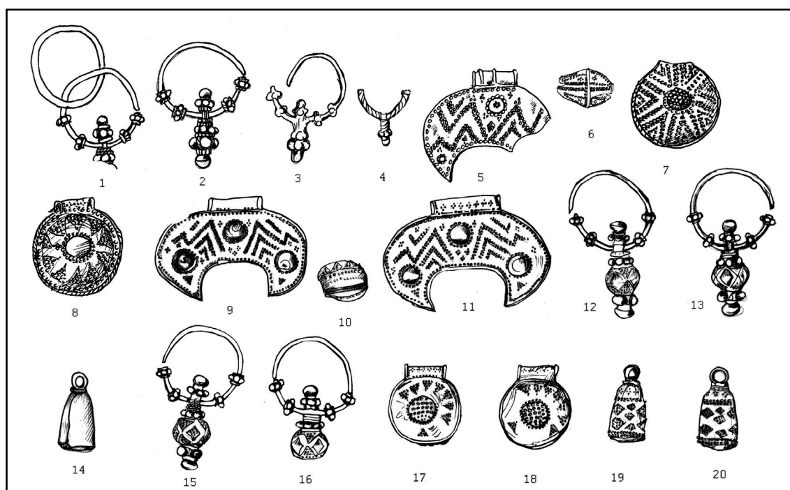
Рис. 3. Ювелирные украшения. Масштабы разные. 4 — бронза, остальные — серебро. 1—8 — Екимауцы (Республика Молдова), 9—20 — Червоне (Украина).

Ювелирный инструментарий был встречен и вне пределов этой землянки. На городище были найдены еще пять тиглей, маленький ювелирный молоточек, зубильце, 2 матрицы для тиснения, серебряная и медная проволока (Федоров 1953: 104—127). В культурном слое городища было найдено 19 саманидских дирхемов, младшие тринадцать монет относятся к чеканкам Насра ибн Ахмада (914—943). Шестнадцать дирхемов имеют по два отверстия (Рабинович 1999: 263).