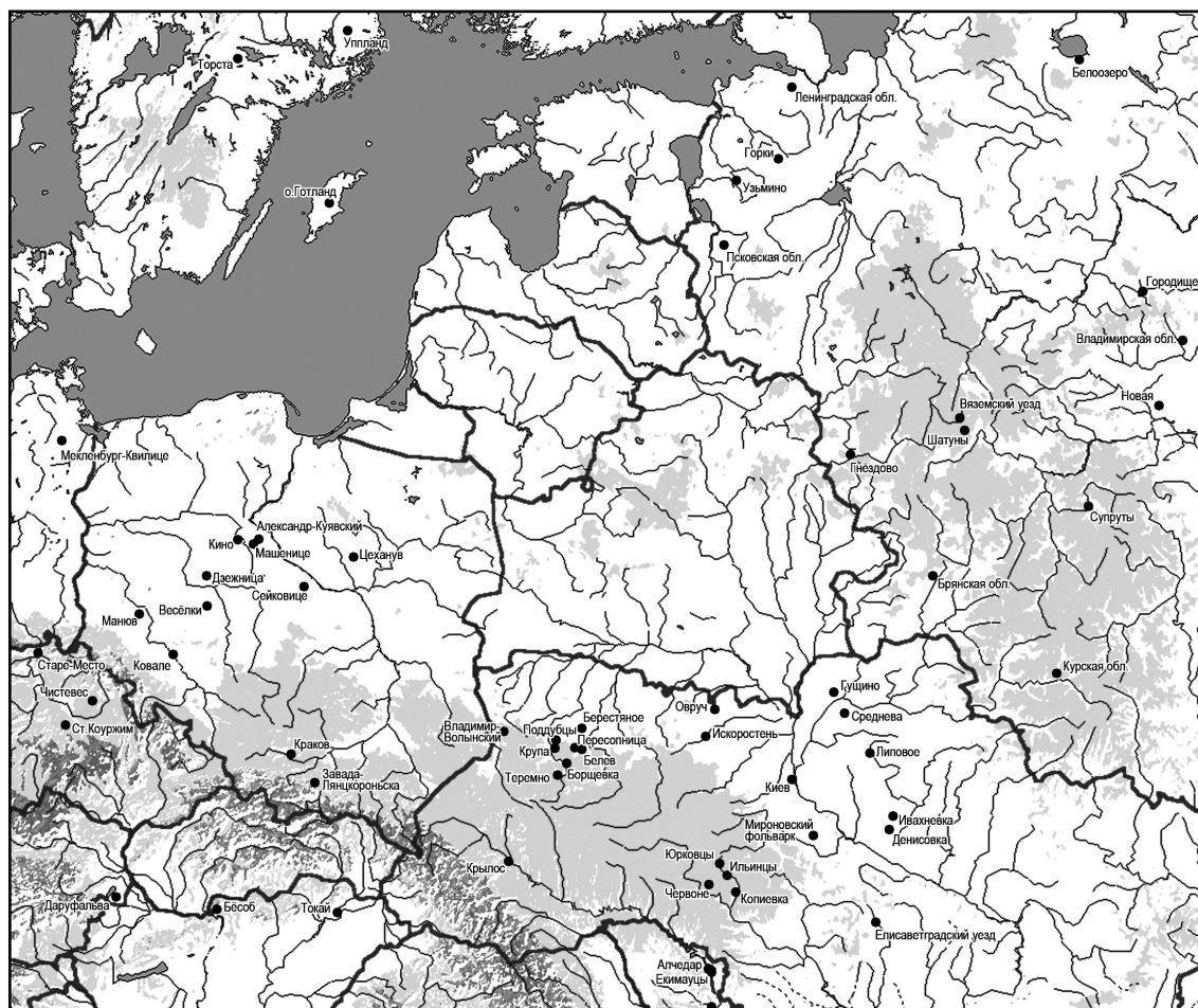
Карта 1. Пункты упомянутые в работе.

Украшение из клада Алчедар представляет собой первую подобную находку в Пруто-Днестровском междуречье. От известных аналогов это украшение отличает любопытная деталь: на его дужку нанизаны специфические ложчатые бусины, как бы имитирующие пояски зерни (рис. 1: 1). Интересно, что подобные необычные бусинки включены и в состав двух сложных подвесок серег типа «В», найденных в этом же комплексе (рис. 1: 5). Это наблюдение позволяет считать данные украшения произведениями одного и того же мастера, использовавшего такой нестандартный конструктивный и декоративный прием.