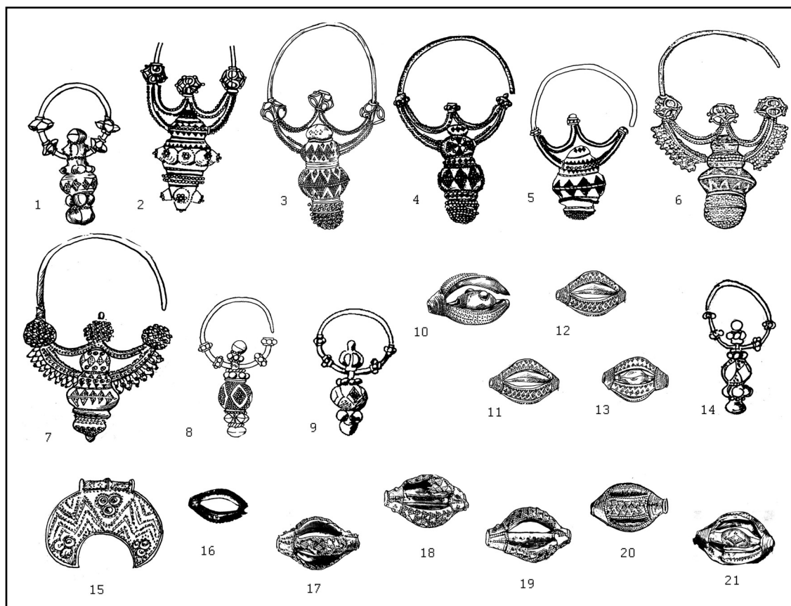
Рис. 2. Серебряные украшения с зернью. Масштабы разные. Все — серебро. 1 — Алчедар (Республика Молдова), 2 — Торста (Швеция), 3, 10 — Гуцино (Украина), 4 — Гнездово (Россия), 5, 6 — Чеханов (Польша), 7 — Борщевка (Украина), 8, 11—13 — Юрковцы (Украина), 9 — бывш. Елизаветградский уезд (Украина), 14—16 — Копиевка (Украина), 17—19 — Угпланд (Швеция), 20 — Готланд (Швеция), 21 — Липовое (Украина), 22 — Сейковик (Польша).

(Šolle 1959: 353—506; Haising, Kiersnowski, Reyman 1966: t. VI, VIII, IX) и, возможно, являются прототипами настоящих лопастных бус. 7