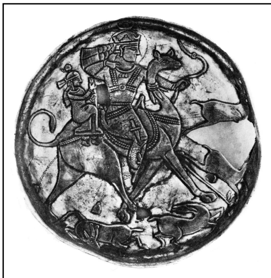
Рис. 3. Серебряное сасанидское блюдо, изображающее шаха Бахрама V Гура (420—438 гг.), охотящегося с однопорогого верблюда. Позади правителя сидит арфистка Азада.

В целом в ахеменидскую эпоху участие женщин в кампании ограничивалось нахождением в обозе, где они были поварами или служили утехам мужчин (Hdt. VII.83, 187; IX.76, 81; Xen. Cyr. IV.2.2; VI.3.30; Diod. XVII.35.3—7; Curt. III.3.22—25, 9.6, 11.21—25; Just. XI.9.12; Plut. Alex. 21.1; Arr. Anab. II.11.9). Ксенофонт (Cyr. IV.3.2), знавший Персию, так сказать, «изнутри», пишет об этой древней традиции азиатов: «Ведь еще и теперь все идущие в поход в Азии, идут походом, имея с собой наиболее ценное, говоря, что лучше сражаются, если очень любимые вещи находятся вблизи, ведь им, — они говорят, — необходимо смело защищать их. Возможно, это так и есть, но возможно, они делают это, угождая своей страсти». Таким образом, по объяснениям самих подданных царя царей, они возили с собой свои семьи с целью вдохнуть в себя мужество в бою. Поскольку воин сражается доблестнее, зная, что за ним находится его семья и в случае поражения она окажется в плену. Действительно, нельзя исключить происхождения данного обычая от типично кочевой практики произведения набега вместе с семьей, однако во время Ксенофонта (рубеж V—IV вв. до н. э.) военная практика, очевидно, далеко отошла от происхождения данной традиции. Сами персы, вероятно, действительно полагали, что нахождение их семей в обозе придает им мужество во время битвы, но, естественно, прав и греческий историк, усматривая причину присутствия женщин