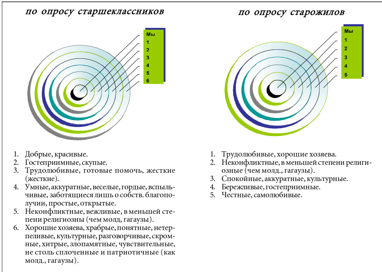
Рис. 1. Относительная дистанция между «образом мы» и данными ему характеристиками.

ния были выбраны следующие этносы: местный болгарин, молдаванин, гагауз, русский, украинец, болгарин из Болгарии. Сравнение происходило в триадах, было необходимо выявить, чем двое отличны от третьего. Назывался признак, по которому происходило сравнение. Далее отмечались лица, которые также были схожи по названному признаку. Признаки разделялись и по модальности, т.е. положительной или отрицательной направленности.